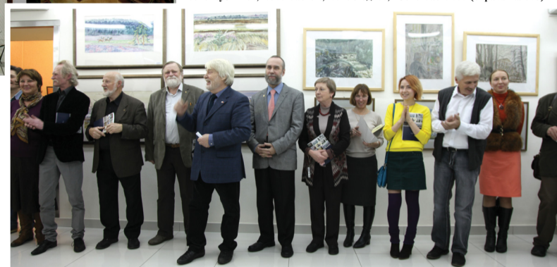
Сотрудники кафедры рисунка на открытии выставки