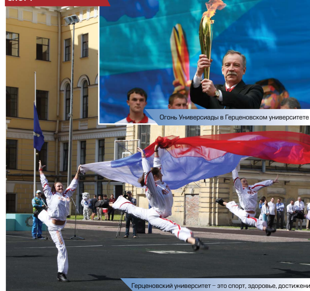
Огонь Универсиады в Герценовском университете