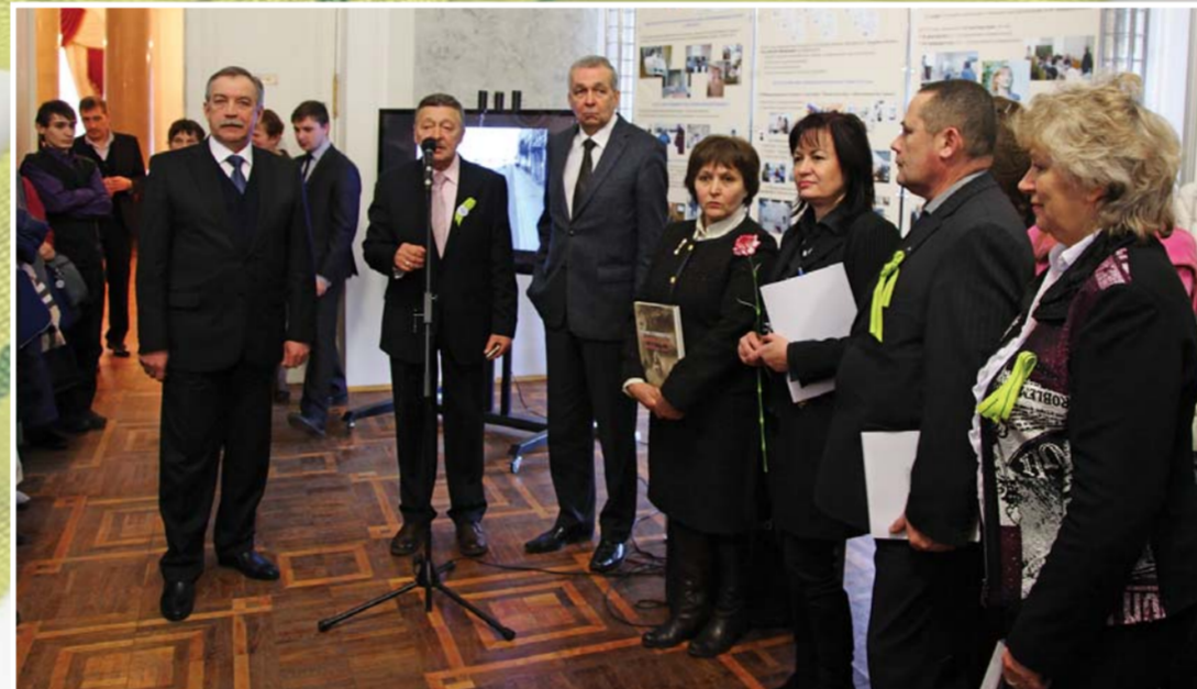
Открытие выставки «Герценовский рубеж стойкости: хроника блокадных дней»