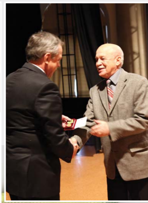
Торжественное награждение блокадников-сотрудников Герценовского университета памятным юбилейным знаком «70 лет со дня полного освобождения Ленинграда от фашистской блокады»