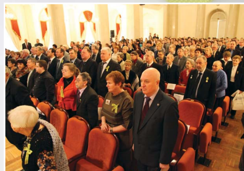
Всероссийская историко-культурная конференция «Блокада Ленинграда: история города в памяти поколений»