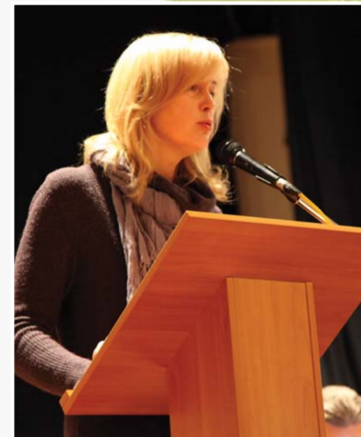
Выступление первого заместителя председателя Комитета по науке и высшей школе Санкт-Петербурга И.Ю. Ганус