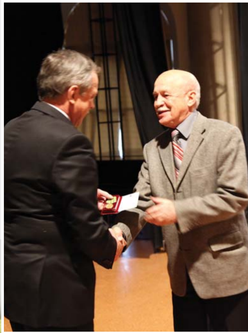
Торжественное награждение блокадников-сотрудников Герценовского университета памятным юбилейным знаком «70 лет со дня полного освобождения Ленинграда от фашистской блокады»