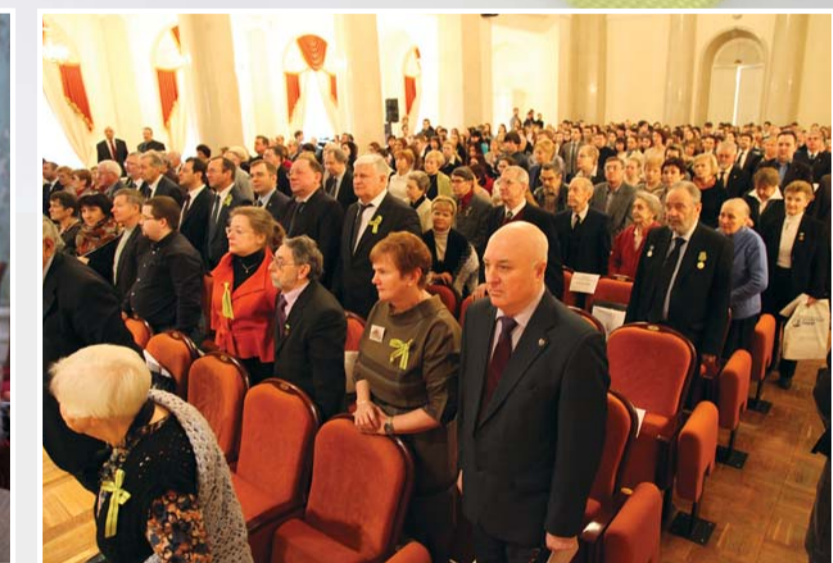
Всероссийская историко-культурная конференция «Блокада Ленинграда: история города в памяти поколений»

24 января в рамках всероссийской историко-культурной конференции «Блокада Ленинграда: история города в памяти поколений» в залах РГПУ им. А.И. Герцена прошли секционные заседания, посвященные блокадным дням.