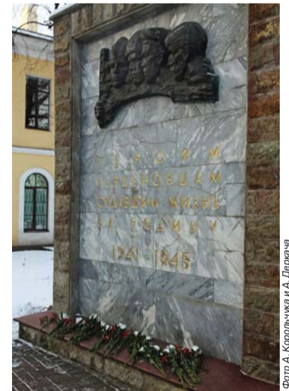
Верстка Г. Сергеевой