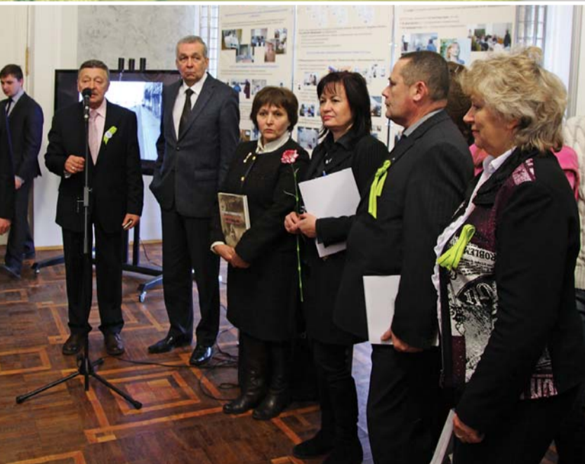
ценниковый рубеж стойкости: хроника блокадных дней»