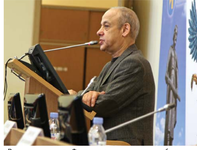
Выступление директора Федерального института развития образования, академика Российской академии образования А.Г. Асмолова

Сегодня происходит переосмысление места человека в этом мире. Можно сказать, что возникает угроза антропологической катастрофы. И именно образование должно помочь человеку обрести себя в современном мире. И это не пустая метафизическая тема. Напротив, это понятие имеет прямое отношение к современному образованию.