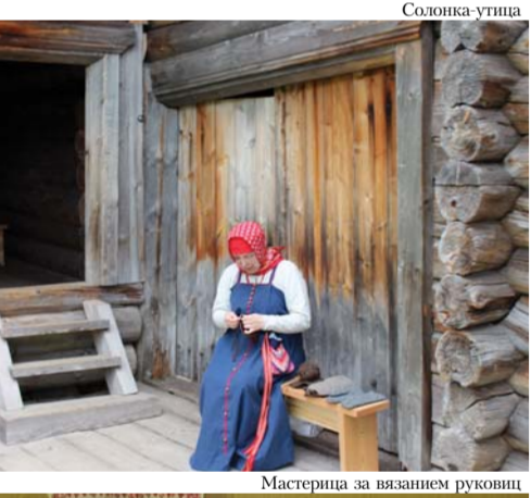
Мастерица за вязанием рукавиц