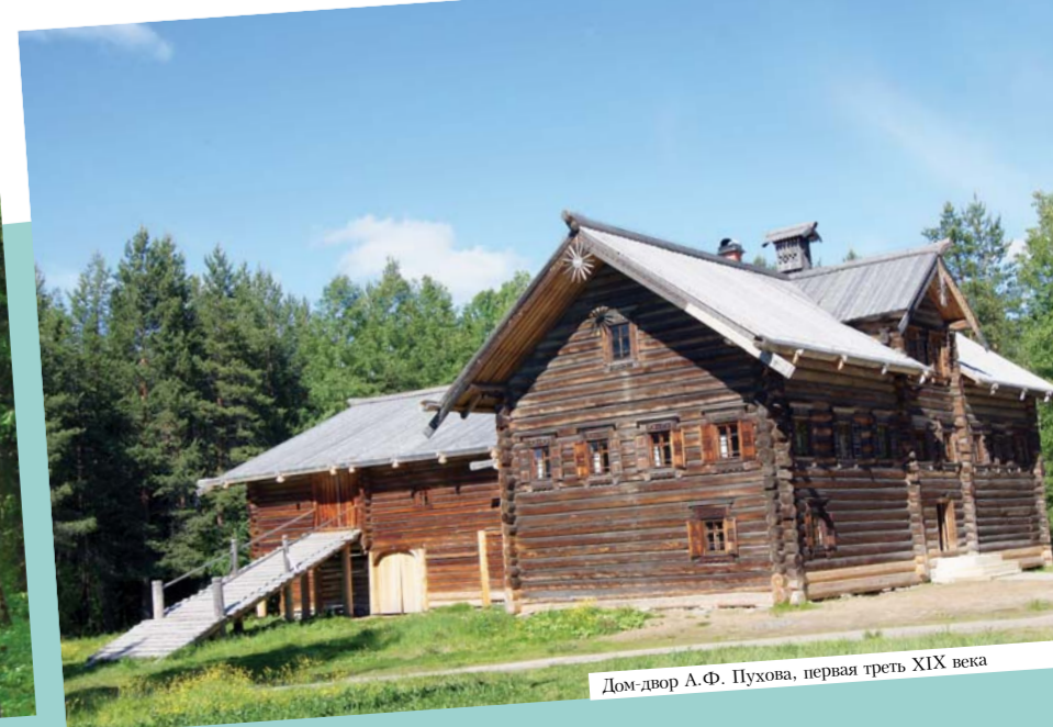
Дом двора А.Ф. Пухова, первая треть XIX века