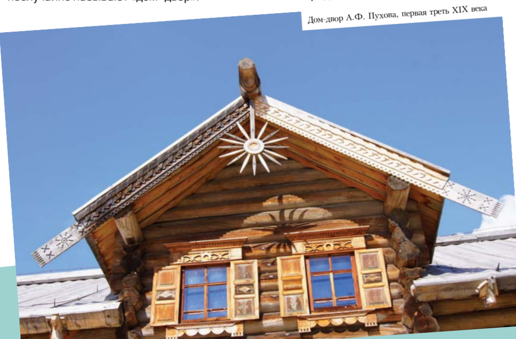
Дом двора А.Ф. Пухова, первая треть XIX века