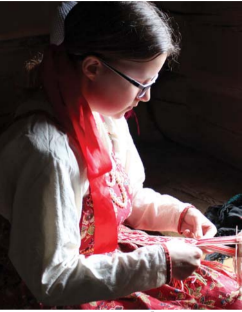
За изготовлением пояса