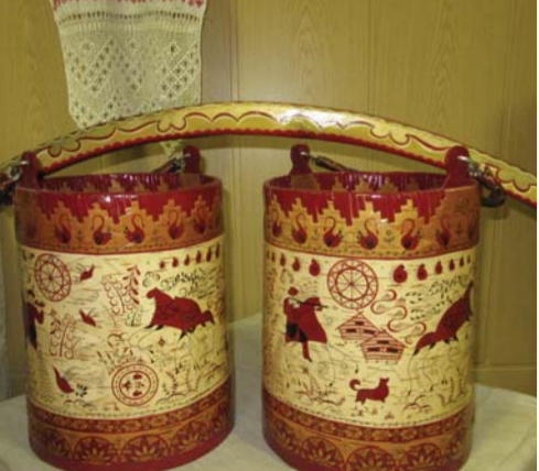
Музей в Уйме. Богородская роспись