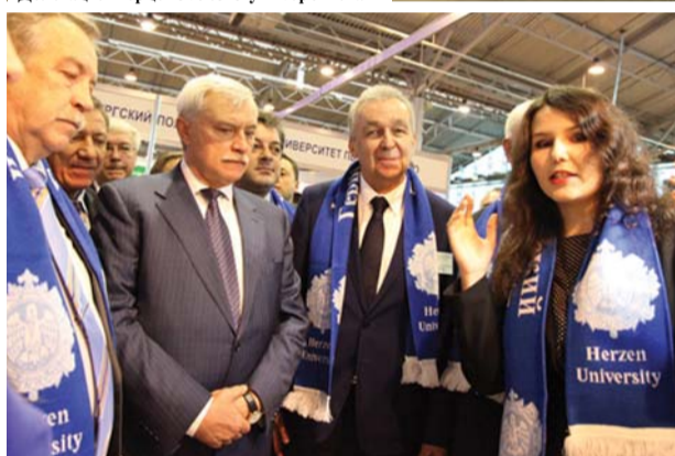
Георгий Полтавченко у стенда РГПУ им. А.И. Герцена