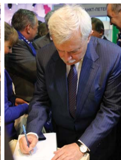
Георгий Полтавченко оставляет запись в книге гостей