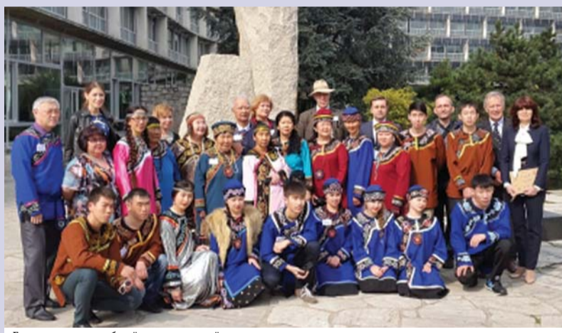
Гости и участники юбилейных мероприятий