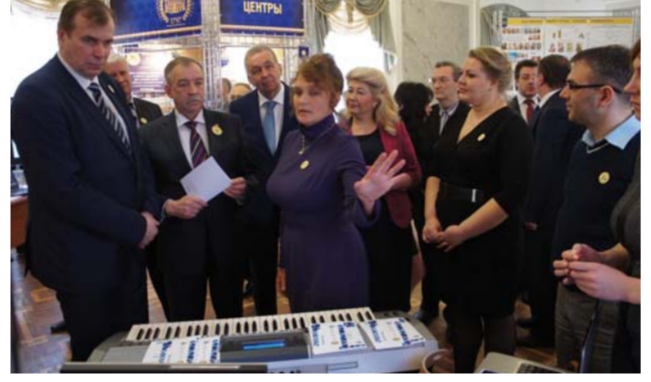
Смотр выставки научных разработок аспирантов и студентов в Голубом зале