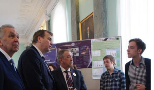
Смотр выставки научных разработок аспирантов и студентов в Голубом зале