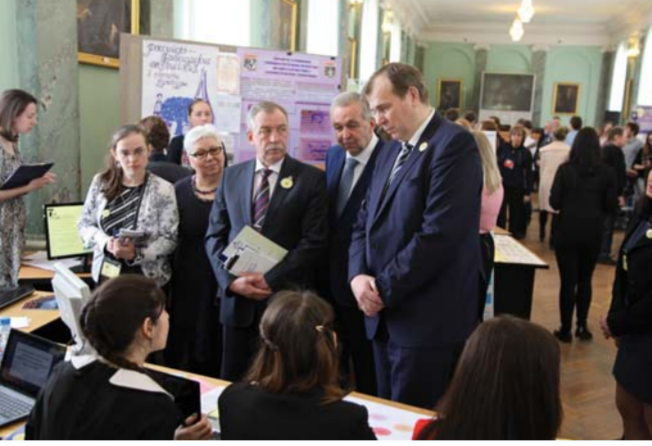
Смотр выставки научных разработок аспирантов и студентов в Голубом зале

В номинации «Учебно-методический комплекс, учебник, разработка для системы общего образования» дипломами первой степени награждены: — доцент кафедры олигофрено-