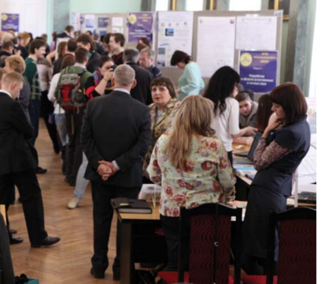
Смотр выставки научных разработок аспирантов и студентов в Голубом зале

В номинации «Учебно-методический комплекс, учебник, разработка для высшей школы в области математических и естественно-научных дисциплин» дипломами первой степени награждены: