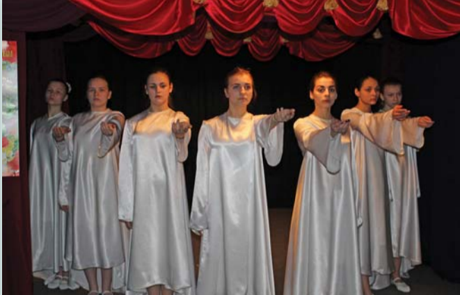
Танцевально-поэтическая композиция «Журавли». Театральная студия «Конфетти». Художественный руководитель – Ю.С. Чистякова