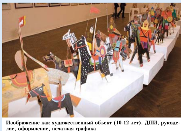
Изображение как художественный объект (10-12 лет). ДШИ, рукоделие, оформление, печатная графика