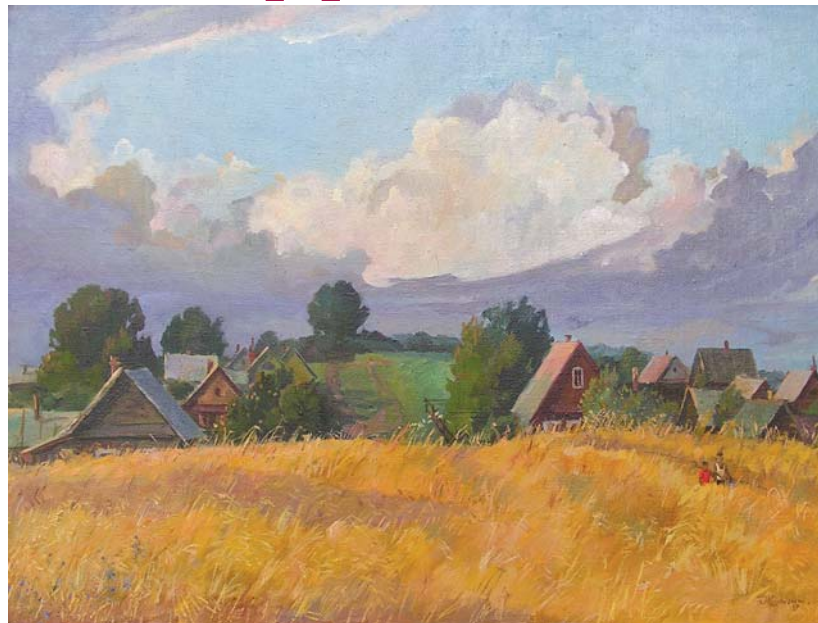
«Жигиты», масло, холст, 1990