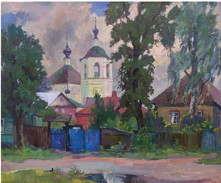
«Торопец. Синие ворота», масло, холст, 1998