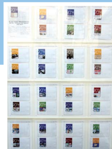
Экспонат редакции газеты «Педагогические вести»