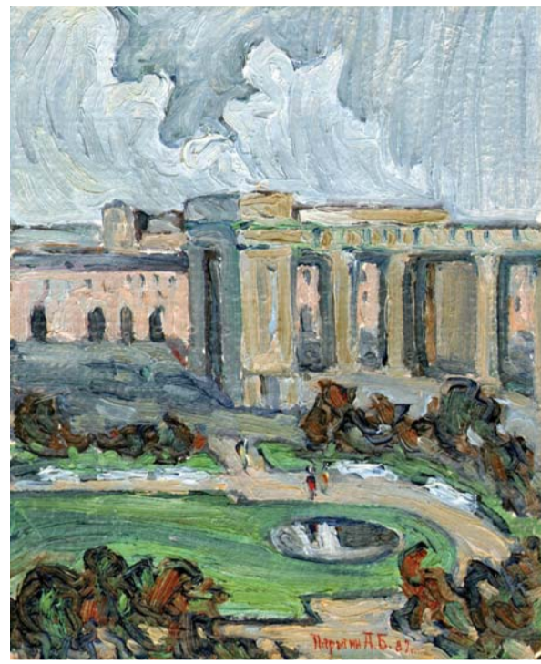
Сквер у Казанского собора (из окна мастерской). 1989, картон, масло

В результате капитальной реконструкции 1995—1997 годов здание переоборудовано в четырехэтажный бизнес-центр. Мансарды 1933 года были снесены, внутренний двор перекрыли стеклянной крышей.