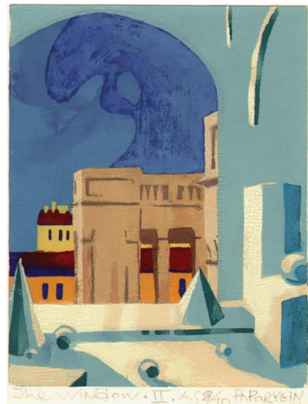
Окно II. 1992, бумага, шелкография