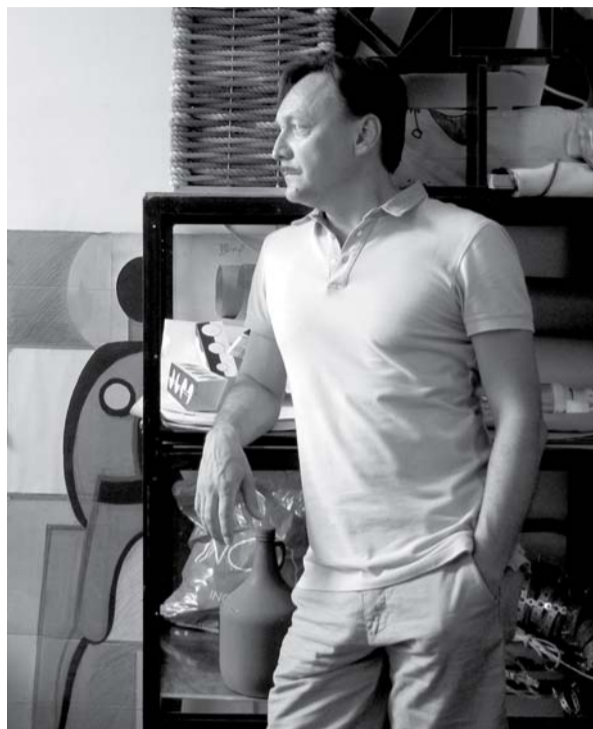
Автопортрет. 2012, фотография