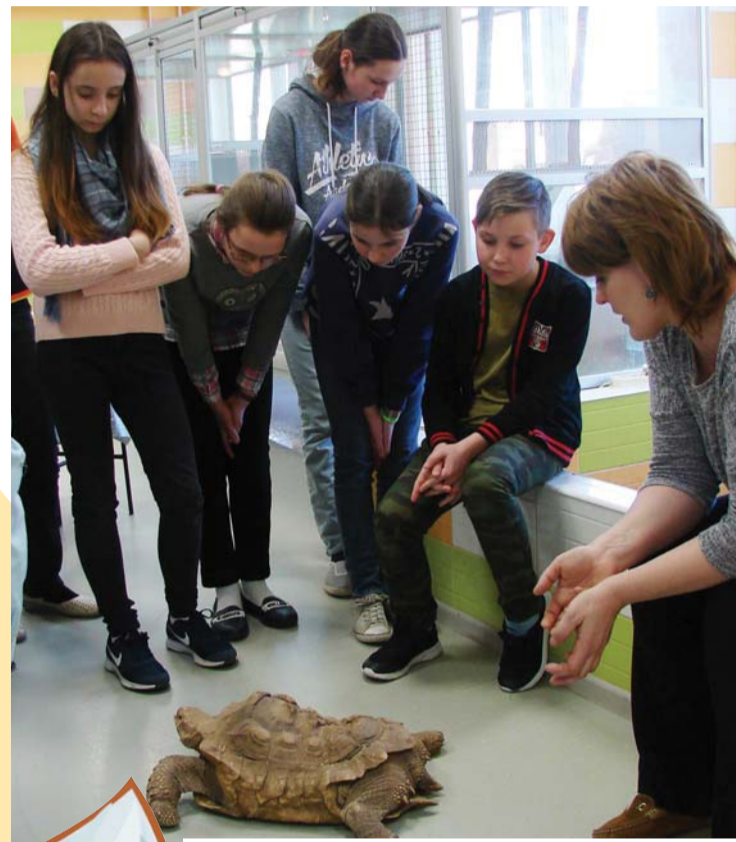
На занятиях в КЮНе Дворца детского (юношеского) творчества Фрунзенского района Санкт-Петербурга