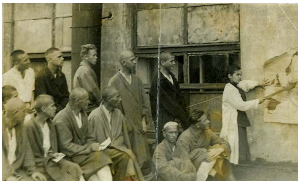
На полтинформации для раненых в госпитале №1014, располагавшемся в годы войны на территории института.