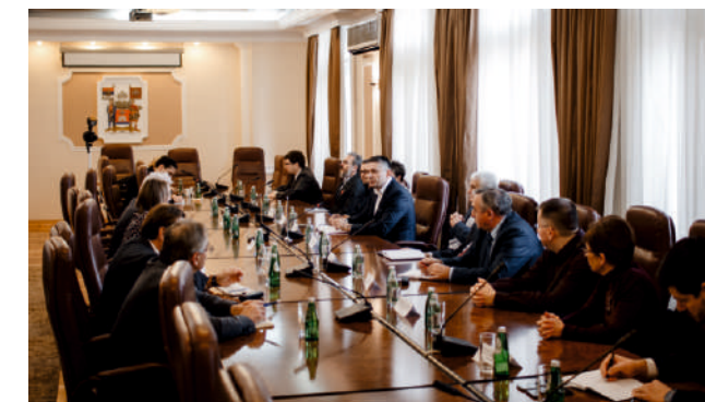
Переговоры с руководством города Ниш и представителями Нишского университета

– Сегодня в мэрии Ниша состоялась встреча, посвященная открытию Центра открытого образования и обучения на русском языке. Какие проблемы обсуждались?