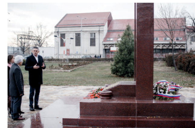
Петербургская делегация и заместитель мэра города Ниш Милош Банджур у мемориала солдатам-освободителям