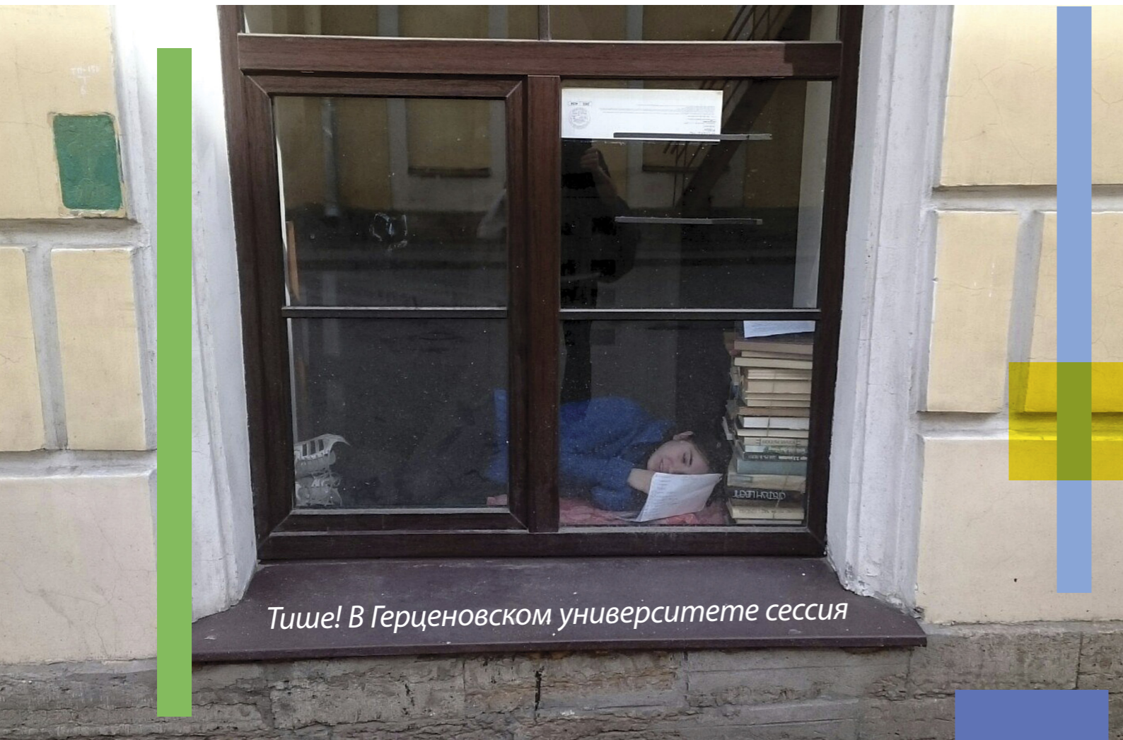
Тише! В Герценовском университете сессия