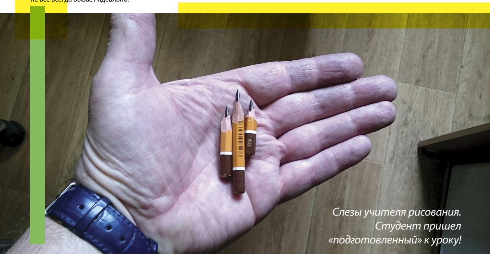
Слезы учителя рисования. Студент пришел «подготовленный» к уроку!