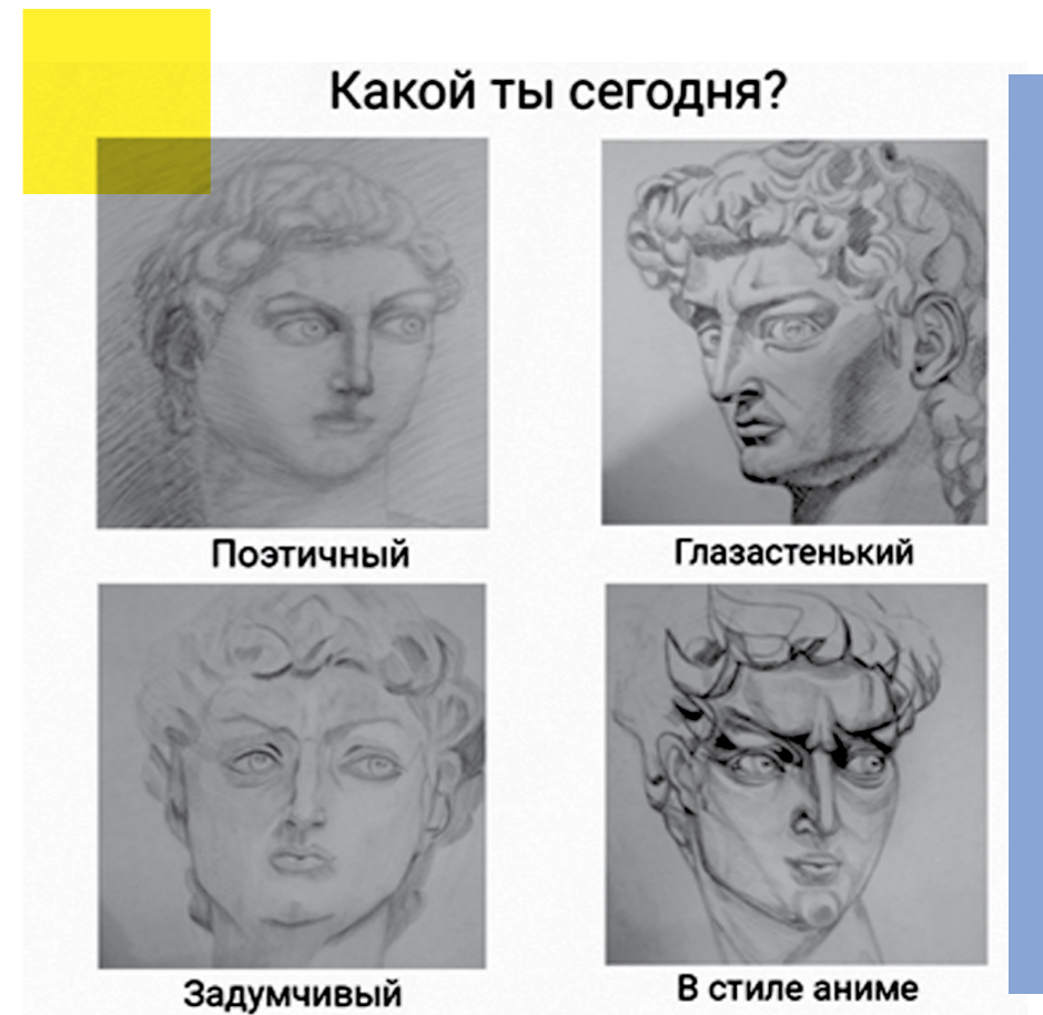
РИСУНОК ОТ СТУДЕНТОВ 2 КУРСА ФИИ

Лучший отдых после уроков для ребенка – это компьютер и телевизор. И вам спокойно, и ребенок занимается своими