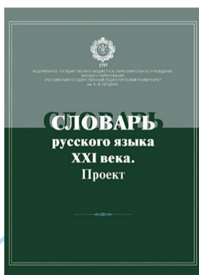
«СЛОВАРЬ РУССКОГО ЯЗЫКА XXI ВЕКА. ПРОЕКТ» под редакцией Г. Н. Скляревской

В книге описана новая и несколько необычная методика обучения детей русскому языку – автор предлагает представить, что русский язык является для ученика иностранным. Этот необычный метод опирается на осуществляемого с учётом особенностей когнитивной базы русского культурного сообщества и этнопсихологических особенностей развития детей в процессе языкового образования.