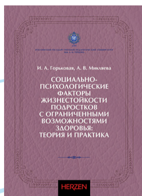
«СОЦИАЛЬНО-ПСИХОЛОГИЧЕСКИЕ ФАКТОРЫ ЖИЗНЕСТОЙКОСТИ ПОДРОСТКОВ С ОГРАНИЧЕННЫМИ ВОЗМОЖНОСТЯМИ ЗДОРОВЬЯ: ТЕОРИЯ И ПРАКТИКА» Горьковая И. А., Микляева А. В.

Методики составления словарей также постоянно меняются в зависимости от потребностей тех, кто их использует. Данная книга – не словарь, а пособие, в котором представлены новые и во многом уникальные методы составления словарей. Также в ней подробно описываются все элементы словарной статьи – от заголовка до иллюстраций.