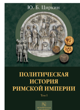
«ПОЛИТИЧЕСКАЯ ИСТОРИЯ РИМСКОЙ ИМПЕРИИ (В ДВУХ ТОМАХ)» Циркин Ю. Б.

Этот научно-популярный труд будет интересен не только филологам, специализирующимся на литературе русского зарубежья, но и всем, кто увлекается биографиями известных литераторов. Помимо простого рассказа о судьбах эмигрировавших во Францию поэтов и писателей, автор называет читателю конкретные адреса их проживания в Париже, что делает книгу ещё более увлекательной.