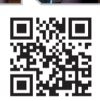
Центр социальных инициатив РГПУ им. А. И. Герцена