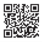
Рисует в РГПУ им. А. И. Герцена