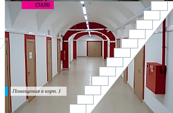
Помещения в корп. 1