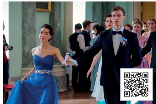
ПРОЕКТ «КУЛЬТУРА ПРАЗДНИКА»

ТОТ, КТО неравнодушен к вопросам защиты окружающей среды и хочет внести свой вклад в их решение, сделав город и область чище, может присоединиться к экологическому клубу РГПУ им. А. И. Герцена «Зелёный пеликан». Клуб работает по нескольким направлениям: экологическое волонтерство, экоросещение и внедрение раздельного сбора мусора в стенах университета. Волонтерство в сфере защиты окружающей среды — это не только полезно и актуально, но и очень увлекательно. Члены клуба выезжают в разные уголки Ленинградской области, чтобы участвовать в различных экологических акциях, очищать от мусора леса и водоёмы, высаживать деревья. Чтобы прививать основы экологической грамотности подрастающему поколению, волонтеры проводят тематические уроки в школах. А участие в конференциях и фестивалях позволяет обмениваться опытом, чтобы совершенствовать свою деятельность. К тому же, участвуя в подобной деятельности, можно узнать много полезной информации, которая поможет сделать более экологичным и собственный образ жизни.