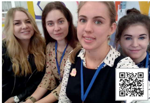
РАСКРОЙ СВОИ ТАЛАНТЫ!

Не только учёба, но и творчество, волонтерские проекты, активный досуг и незабываемые педагогические и трудовые сезоны студотрядов — всего этого складывается насыщенная и яркая студенческая жизнь. А если в ней и возникнут трудности, герценовцы не останутся с ними один на один — на помощь обязательно придёт Совет обучающихся.