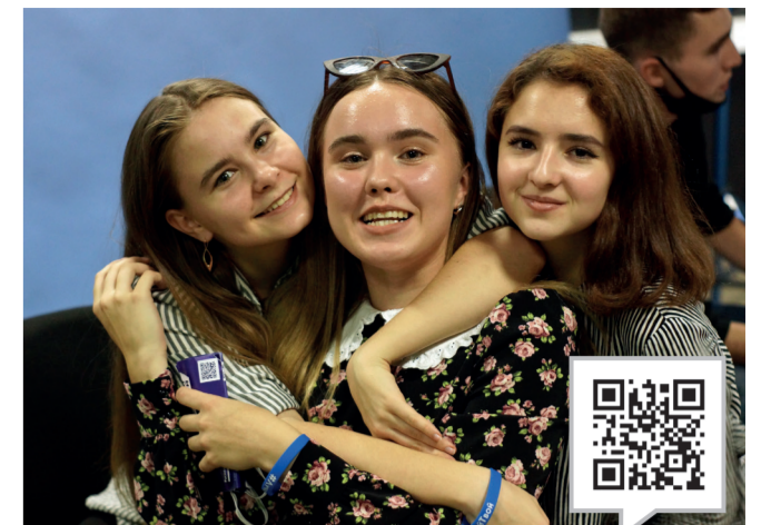
ПРО ГЕРЦЕНОВСКИЙ УНИВЕРСИТЕТ

PROHERZEN — это команда инициативных ребят, которые показывают Герценовский университет студентам глазами студентов. Здесь каждый желающий может попробовать себя в роли сценариста, режиссёра, оператора или ведущего. Это отличная возможность прикоснуться к миру создания видеороликов изнутри. ProHerzen освещает все аспекты бурной студенческой жизни: от молодёжных фестивалей и спортивных мероприятий до праздничных балов и всероссийских форумов. Проект «Призвание и признание», который ведёт ProHerzen, рассказывает о самых ярких выпускниках, обучающихся и сотрудниках вуза, которые являются примером для подражания и ориентиром для студентов. YouTube-канал этого объединения — настоящая летопись университетской истории, в которой отмечены важнейшие вехи последних лет. Прикоснуться к ней можете и вы!