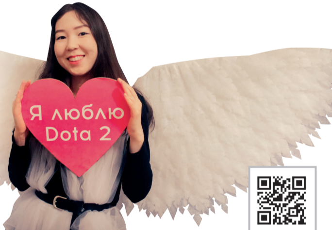
ГИК: ГЕРЦЕНОВСКИЙ ИГРОВОЙ КЛУБ

PROHERZEN — это команда инициативных ребят, которые показывают Герценовский университет студентам глазами студентов. Здесь каждый желающий может попробовать себя в роли сценариста, режиссёра, оператора или ведущего. Это отличная возможность прикоснуться к миру создания видеороликов изнутри. ProHerzen освещает все аспекты бурной студенческой жизни: от молодёжных фестивалей и спортивных мероприятий до праздничных балов и всероссийских форумов. Проект «Призвание и признание», который ведёт ProHerzen, рассказывает о самых ярких выпускниках, обучающихся и сотрудниках вуза, которые являются примером для подражания и ориентиром для студентов. YouTube-канал этого объединения — настоящая летопись университетской истории, в которой отмечены важнейшие вехи последних лет. Прикоснуться к ней можете и вы!