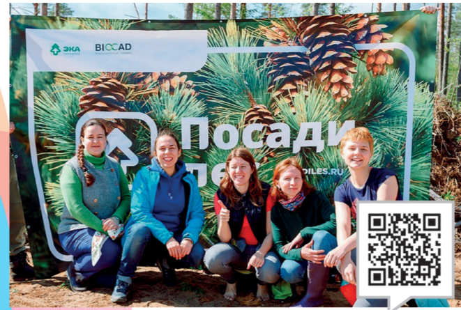
ЭКОЛОГИЧЕСКИЙ КЛУБ «ЗЕЛЁНЫЙ ПЕЛИКАН»

Создатели клуба считают, что в рамках внеучебной деятельности можно выстроить эффективную систему взаимодействия студентов и преподавателей. В рамках заявленной темы обсуждаются важные общественно-политические события, которые волнуют студенческое сообщество. Заседания Дискуссионного клуба открыты для всех, кто интересуется политическими процессами и событиями. После выступления докладчика участники могут задать вопросы и высказать свое мнение. Формат свободной дискуссии позволяет студентам расширить свой кругозор и сформировать активную гражданскую позицию.