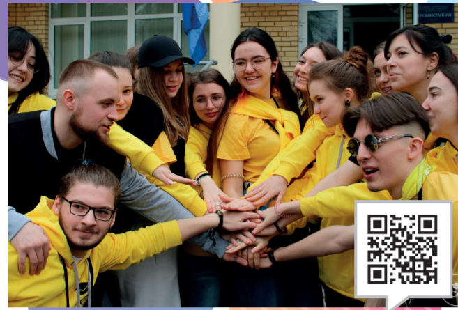
СОВЕТ ОБУЧАЮЩИХСЯ РГПУ ИМ. А. И. ГЕРЦЕНА

СОВЕТ ОБУЧАЮЩИХСЯ — это орган, представляющий интересы студентов. Его главная задача — сделать образовательный процесс комфортным и продуктивным. Именно сюда обращаются те, кому нужна помощь или необходимо зарегистрировать новое студенческое объединение.