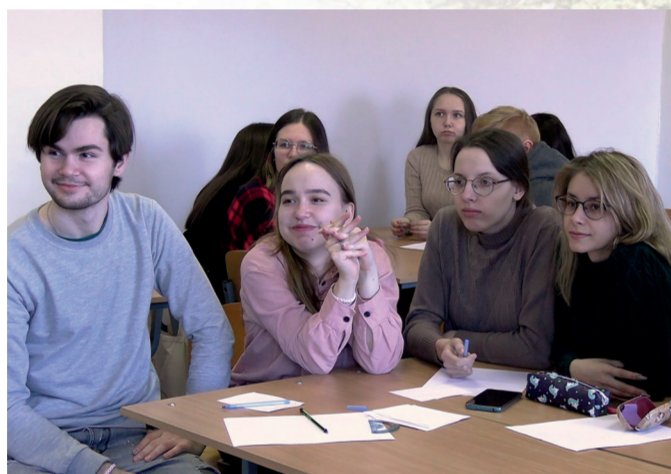
Студенты Волховского филиала

Для Герценовского университета сотрудничество с регионами Севера, Сибири и Дальнего Востока РФ всегда являлось приоритетным направлением работы. В свете последних поручений Президента Российской Федерации деятельности университета по подготовке высококвалифицированных педагогических кадров для регионов приобретает особое значение. Только вместе с регионами Севера, Сибири и Дальнего Востока возможно комплексно решить задачи сохранения и развития языкового и культурного многообразия Российской Федерации.