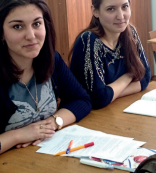
Студенты Дагестанского филиала

Студенты филиала активно участвуют в общественной жизни города и республики.