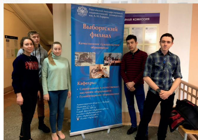
Студенты Выборгского филиала