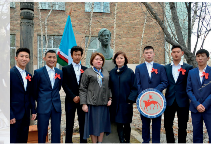
Представительство РГПУ им. А. И. Герцена в Якутии

и Дальнего Востока РФ «Мастерская будущего», международный форум «Арктика: настоящее и будущее», всероссийская научно-практическая конференция «Языки и культура коренных малочисленных народов Севера, Сибири и Дальнего Востока РФ: стратегия сохранения и развития», Форум молодёжи коренных малочисленных народов Севера, Сибири и Дальнего Востока РФ «Российский Север», международный симпозиум «Межэтнические и языковые взаимодействия в социокультурном пространстве России: прошлое и настоящее» и др.