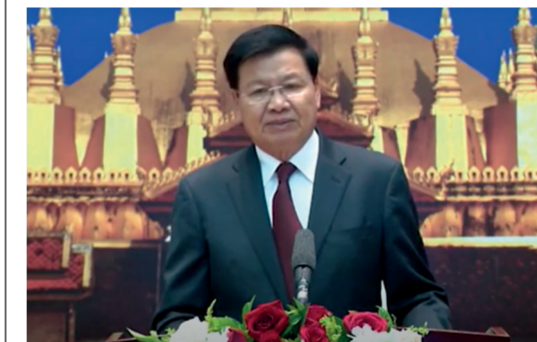
ТХОНГЛУН СИСУЛИТ, президент Лаосской Народно-Демократической Республики

РГПУ им. А. И. Герцена всегда оставался в строю вместе со своими славными профессорами, выдающимися педагогами и студентами. Пытаюсь представить, сколько талантливых и востребованных профессионалов вышли из стен вуза за 225 лет. Их них 17 студентов – из Лаосской Народно-Демократической Республики. В числе этих 17 счастливиц был и я. С тех пор прошло более 40 лет, но я никогда не забуду свою alma mater. Я всегда буду благодарен своим любимым преподавателям из славного и героического Ленинграда.