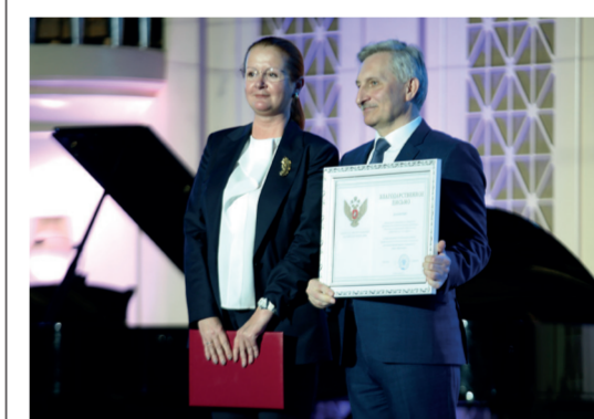
СЕРГЕЙ МИРОНОВ, депутат Государственной Думы

РГПУ им. А. И. Герцена всегда оставался в строю вместе со своими славными профессорами, выдающимися педагогами и студентами. Пытаюсь представить, сколько талантливых и востребованных профессионалов вышли из стен вуза за 225 лет. Их них 17 студентов – из Лаосской Народно-Демократической Республики. В числе этих 17 счастливиц был и я. С тех пор прошло более 40 лет, но я никогда не забуду свою alma mater. Я всегда буду благодарен своим любимым преподавателям из славного и героического Ленинграда.