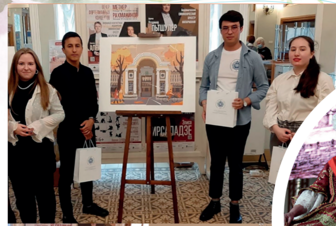
ПРАЗДНИЧНЫЙ КОНЦЕРТ В БОЛЬШОМ ЗАЛЕ ФИЛАРМОНИИ

РГПУ им. А. И. Герцена – это уже бренд, который благодаря своей кропотливой работе, достижениям и реализуемым проектам известен не только в Российской Федерации, но и далеко за рубежом. От всей души поздравляю каждого причастного к жизни университета и желаю продолжать смело идти вперёд, жить полной и радостной жизнью, учиться, учить, творить!