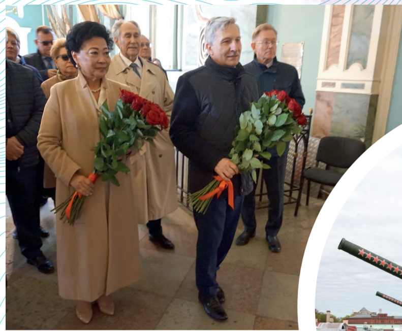
ЦЕРЕМОНИЯ ВОЗЛОЖЕНИЯ ЦВЕТОВ В ПЕТРОПАВЛОВСКОМ СОБОРЕ И ПОЛУДЕННЫЙ ЗАЛП