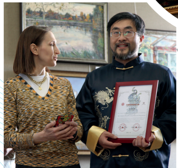
БОРИС ЧЕРНЫШОВ, заместитель председателя Государственной Думы

РГПУ им. А. И. Герцена – это уже бренд, который благодаря своей кропотливой работе, достижениям и реализуемым проектам известен не только в Российской Федерации, но и далеко за рубежом. От всей души поздравляю каждого причастного к жизни университета и желаю продолжать смело идти вперёд, жить полной и радостной жизнью, учиться, учить, творить!