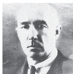
БОЛТУНОВ АЛЕКСАНДР ПАВЛОВИЧ (1883–1942)

Область научных интересов: психологические проблемы профессиональной ориентации и консультации молодежи.