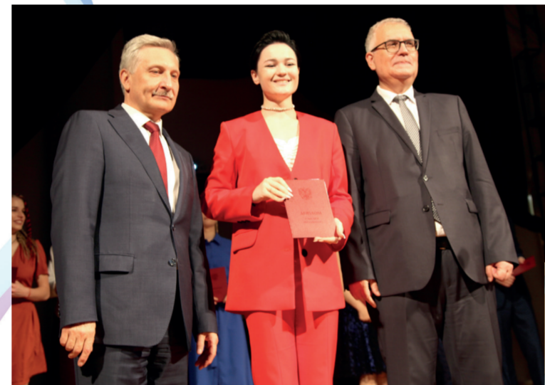
АНДРЕЙ МАКСИМОВ, председатель Комитета по науке и высшей школе Санкт-Петербурга

На протяжении всей своей жизни вы будете гордиться тем, что получили образование в Герценовском университете. Добро пожаловать в нашу большую дружную педагогическую семью! Система образования Санкт-Петербурга действительно огромна, одна из крупнейших в Российской Федерации, и она всегда занимала и занимает лидирующие позиции в системе образования России. Надеюсь, что с вашим участием мы эти позиции будем сохранять, укреплять и развивать дальше. Безусловно, нам хочется, чтобы вы влились в образовательные учреждения Санкт-Петербурга. У нас 688 школ, более тысячи детских садов, почти 60 отдельных крупных учреждений дополнительного образования, и почти в каждой школе сейчас есть отделения дополнительного образования. Это большая система, в ней более ста тысяч работников. Конечно, мы очень ждём молодых педагогов, которые внесут большой вклад в дальнейшее развитие системы.