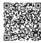
Сюжет телеканала «Санкт-Петербург»

В этом году выпускников Герценовского университета, окончивших обучение с отличием, в Колонном зале поздравили представители руководства Санкт-Петербурга и Ленинградской области и члены ректората РГПУ им. А. И. Герцена.