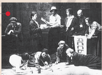
Выход первого номера состоялся в момент становления педагогического образования в стране