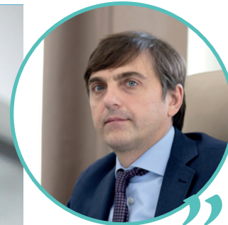
СЕРГЕЙ КРАВЦОВ, министр просвещения Российской Федерации

Замечательно, что подготовка специалистов для системы дошкольного образования так профессионально осуществляется в стенах Герценовского университета и высоко ценится и в нашей стране, и её пределах. Совсем недавно в Ташкенте был открыт филиал РГПУ им. А. И. Герцена, в котором данные программы получили достойное развитие. И очень важно, что узбекские студенты у нас учатся не только в филиале вуза в городе Ташкенте, но и на основной площадке — в Санкт-Петербурге.