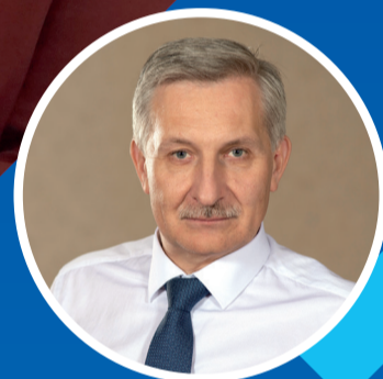
СЕРГЕЙ ТАРАСОВ, И. О. РЕКТОРА РГПУ ИМ. А. И. ГЕРЦЕНА

“ Одной из основных целей системы образования должно быть достижение высокого качества жизни общества и отдельных людей. Качество жизни — это в том числе психологическое и социальное благополучие, это внимание к каждому отдельному человеку. Учитель — прежде всего носитель ценностей, образец моделей поведения. Он помощник для молодого человека, своего рода навигатор не только с точки зрения ориентирования в информационном поле, но и с точки зрения формирования собственного мнения и отношений между людьми.