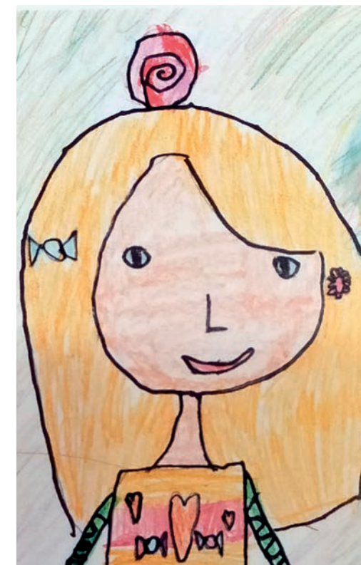
Портрет Александры Николаевны, нарисованный младшеклассниками

— Если говорить о возможностях профессионального развития, то образовательные учреждения в этом смысле уникальны. Особенно, конечно, это дообразование. Когда я работала в Центре творчества и образования, я имела дело с возрастным диапазоном от трёх до семидесяти лет, потому что бабушки и дедушки тоже приходили. Для профессионала это очень хорошая школа, потому что здесь ты практикуешь работу с разными возрастными, с разными ролевыми позициями — с учениками, родителями, учителями, администрацией. Ты учишься соблюдать этические принципы, потому что если психолог в образовательном учреждении нарушил принцип конфиденциальности, по доброй воле к нему уже вряд ли кто-то обратится. И ты очень быстро начинаешь понимать,