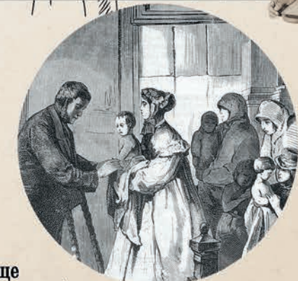
Было создано оспопрививальное отделение