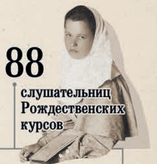
88 слушательниц Рождественских курсов