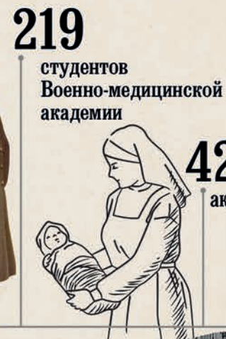
219 студентов Военно-медицинской академии