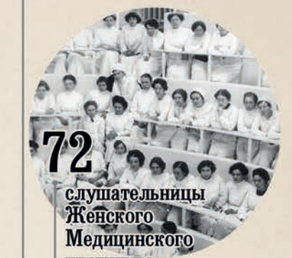
72 слушательницы Женского Медицинского института

в 1900 г. в Воспитательном доме изучали вакцинацию: