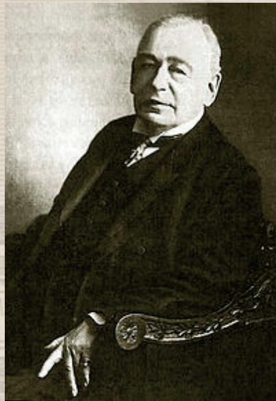
Карл Андреевич Раухфус (1835–1915)