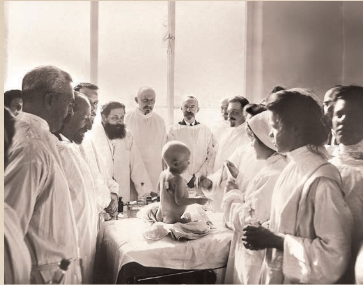
Прививка против оспы в Воспитательном доме.

Первоначально основы медицинских знаний изучали воспитанницы отделения нянь, готовившихся для ухода за младенцами. Профессиональных няnek не хватало, многие семьи выписывали их из-за границы, в основном из Англии или Германии. Общественность была недовольна влиянием этих лиц на молодое поколение. Обращая внимание на негативные стороны такого воспитания, почётный опекун принц П. Г. Ольденбургский предложил открыть в 1848 г. Училище нянь.