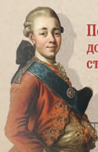
Покровительницей Воспитательного дома по Указу императора Павла I стала императрица Мария