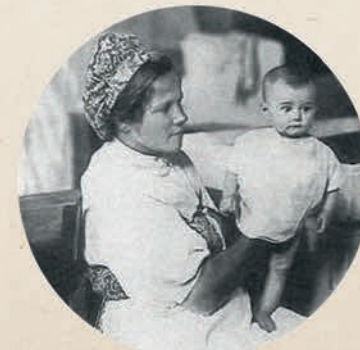
Открывается училище нянь