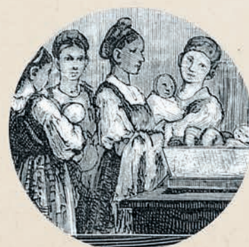
Училище повивальных бабок было преобразовано в Повивальный институт