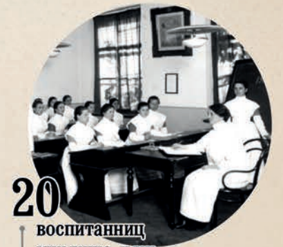
20 воспитанниц училища нянь