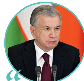
ШАВКАТ МИРЗИЁЕВ, Президент Республики Узбекистан

При обсуждении взаимодействия в культурно-гуманитарной сфере приоритетное внимание уделили вопросам образования. Констатировано, что успешно реализуется совместный проект, совместная инициатива «Класс!» («Зур!»), нацеленная на повышение качества преподавания в Узбекистане русского языка и общеобразовательных предметов на нём. В школы Узбекистана направляются российские учителя, ведётся также переподготовка узбекистанских педагогов.