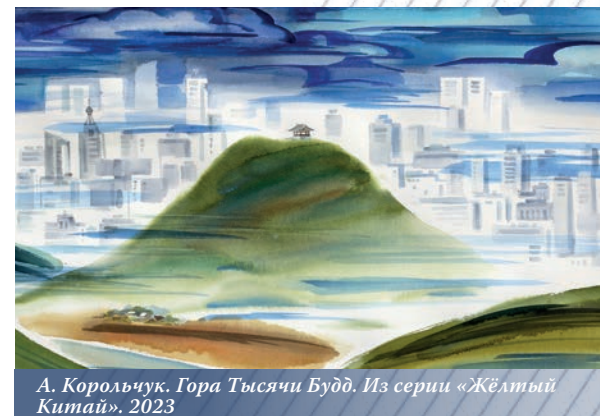
А. Корольчук. Гора Тысячи Будд. Из серии «Жёлтый Китай». 2023

Должен сказать, что при очень быстрых темпах развития во всех областях Китая удивительным образом удаётся сохранять национальные традиции.