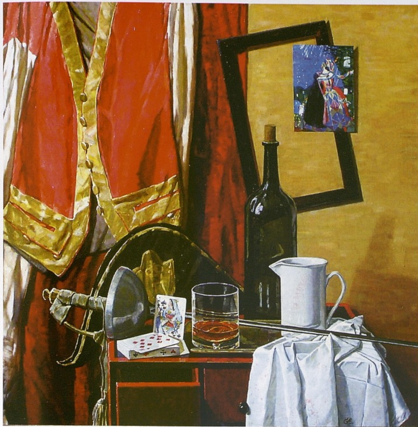
Натюрморт со шпагой, холст, масло, 2005.