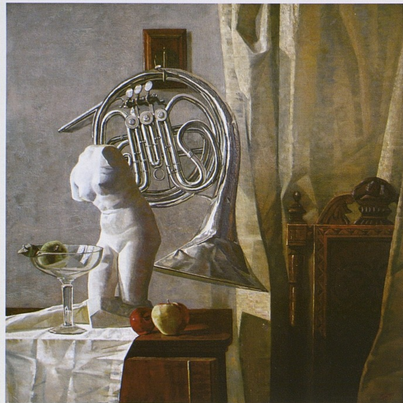
Натюрморт с торсом Венеры, холст, масло, 2006.