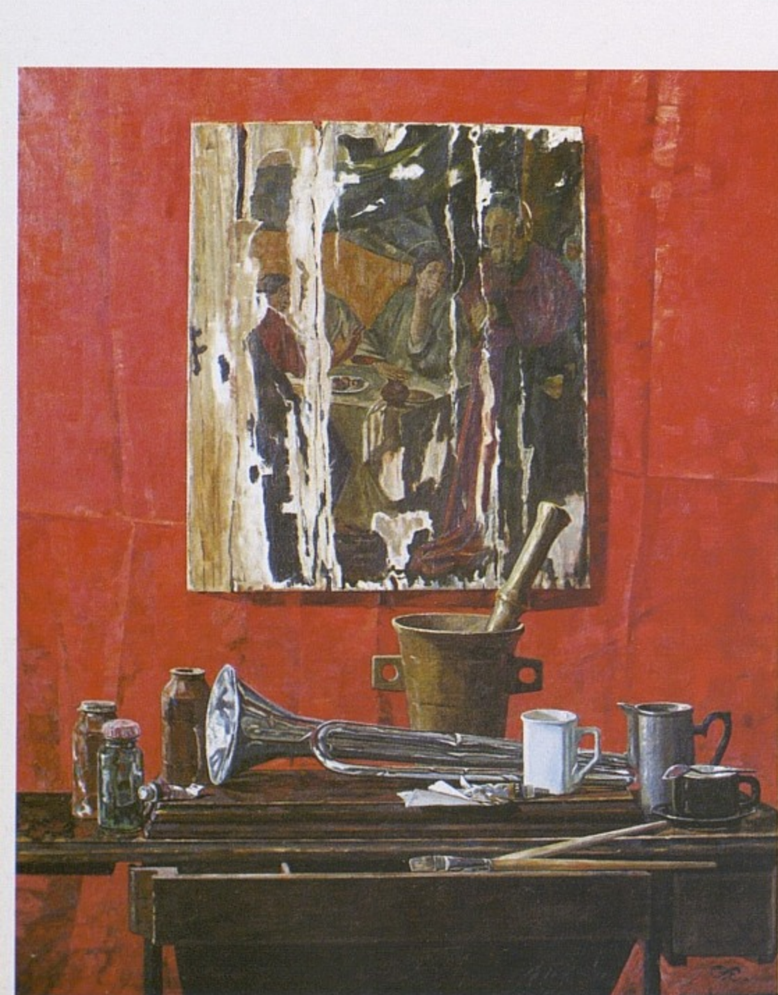
Натюрморт с черно-белой репродукцией, холст, масло, 2006.