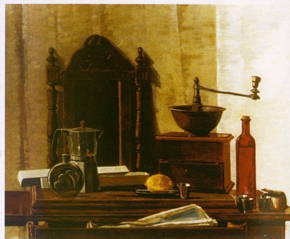
Натюрморт с красной бутылкой, холст, масло, 2005.