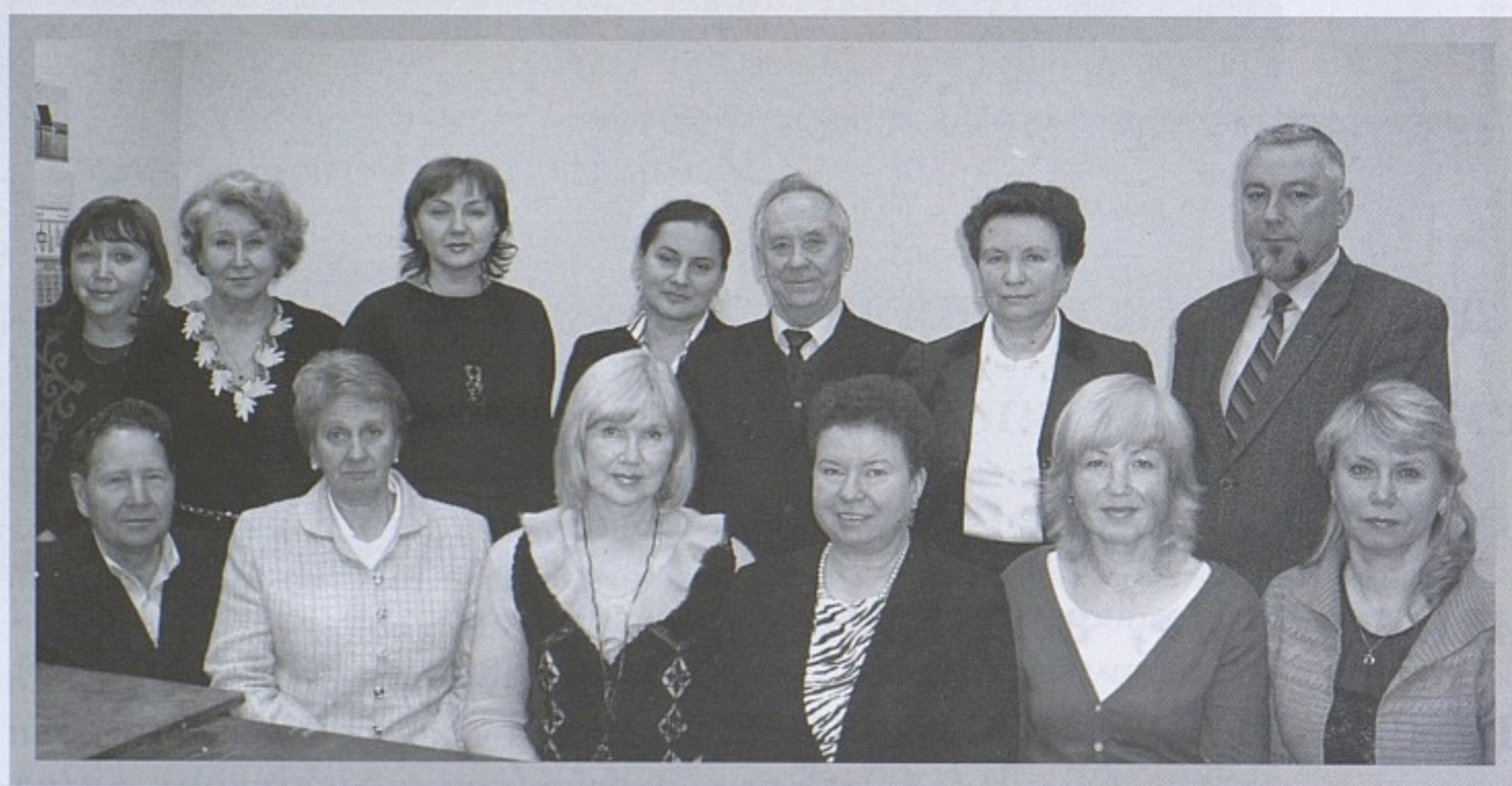
Коллектив кафедры медико-валеологических дисциплин.

45 лет исполнилось со дня основания кафедры медико-валеологических дисциплин, входящей в состав факультета безопасности жизнедеятельности нашего университета.