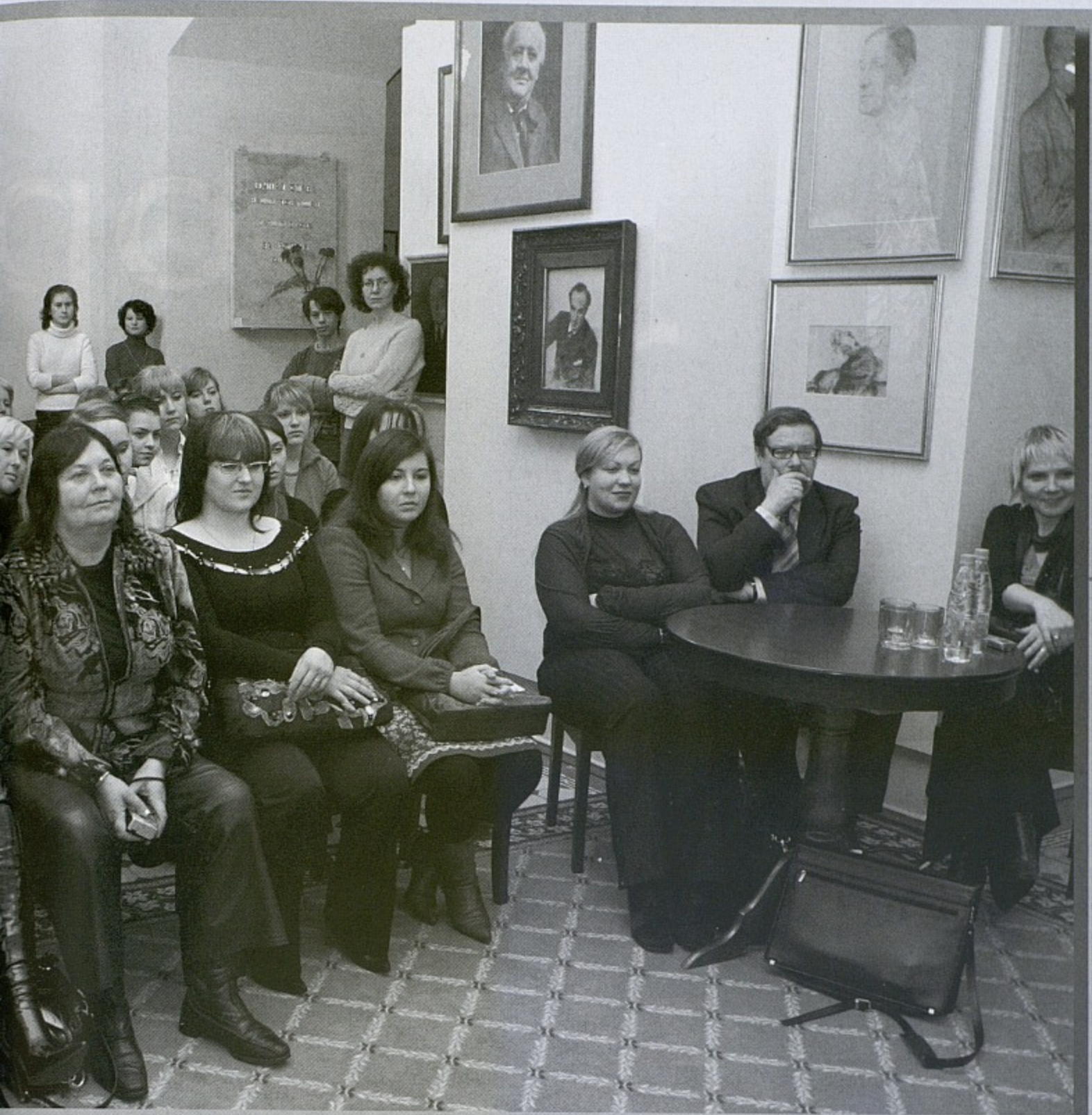
Студенческая конференция по итогам Второго международного фестиваля «Александринский» — «Новый взгляд на традиционный театр».

оценить характер несовпадения систем традиционного театра с новаторской структурой драматургии Чехова. В книге убедительно показано, что за этот период с 1889 по 1902 год в самом театре произошли большие перемены в сценическом решении новой драматургии — от безличной системы жанров и амплуа к стилевому единству спектакля. Таким образом, Чехов во многом способствовал обновлению традиционной системы императорской сцены, происходившей на рубеже XIX-XX веков. Сегодня также наблюдаются перемены, меняющие устоявшиеся стереотипы в театральном искусстве.