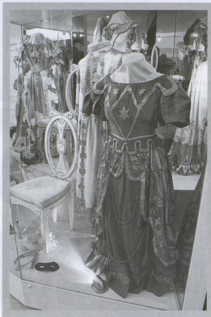
Музей Российского государственного академического театра им. А.С. Пушкина.