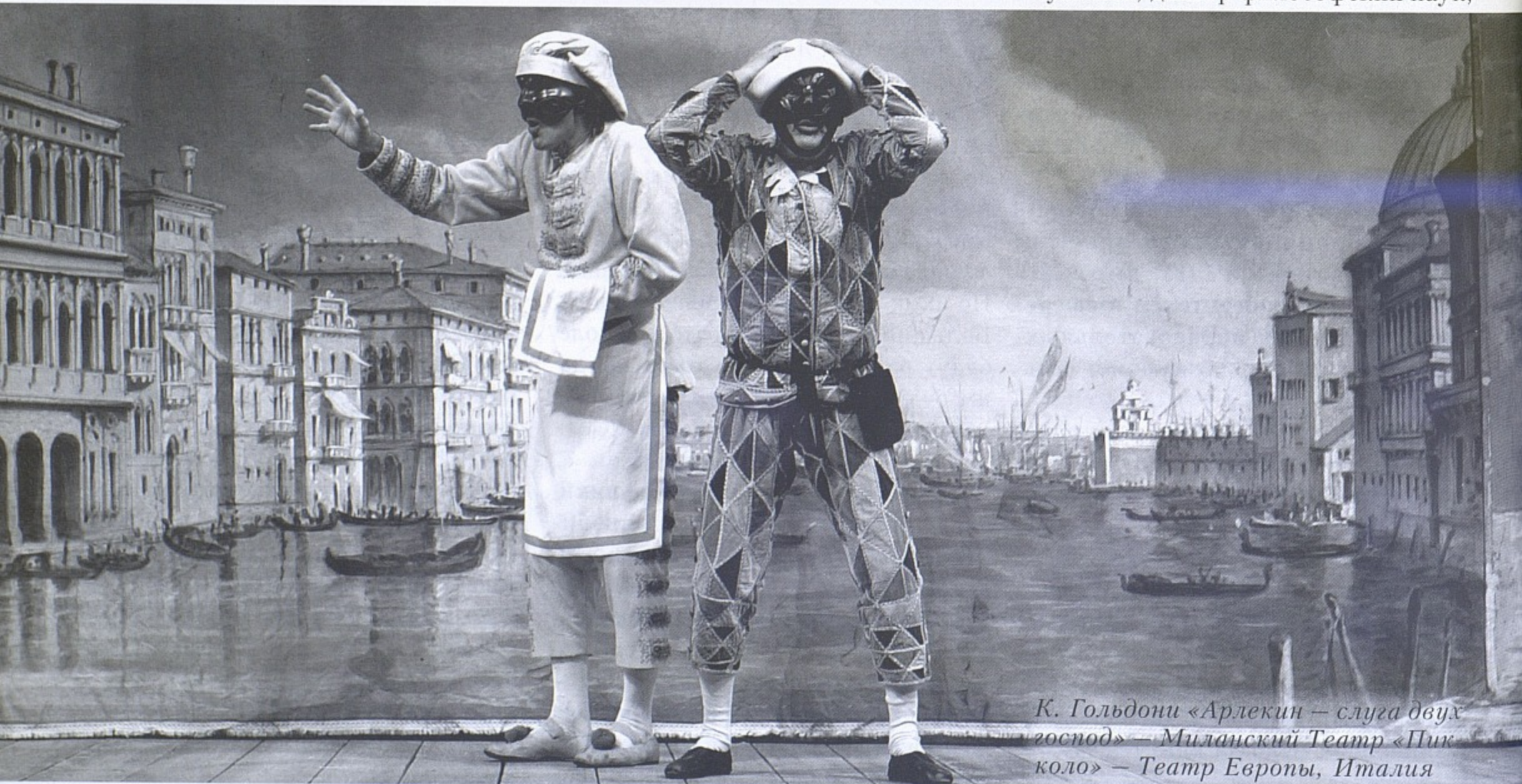
К. Гольдони «Арлекин — слуга двух господ» — Миланский Театр «Пикколо» — Театр Европы, Италия

На предложение Александрийского театра откликнулись и на факультете управления. Декан факультета, доктор философских наук,