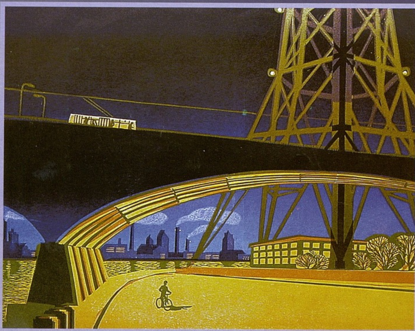
На первой странице журнала «Храм» — цветная линогравюра, 2002; «Работа окончена» — цветная линогравюра, 1986; «Ночь. Кантемировский мост» — цветная линогравюра, 1986.

Композиция иллюстраций кажется простой и логичной, колористическое решение — деликатным. При этом