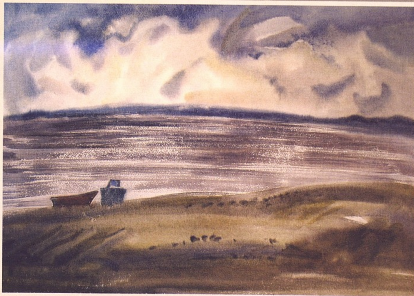
«Холодный день», бумага, акварель, 2007.

дури (курорт состоит из нескольких исторических районов: Лиелупе, Булдури, Дзинтари, Майори, Дубулты, Меллужи, Слока, Каугури, Кемери и др.). До Первой мировой войны в школе садоводства было обустроено показательное хозяйство с 200 видами фруктовых деревьев. В любое время года здесь можно увидеть коллекции цветов, деревьев, кустарников, собранных со всего мира. Красота и яркое цветение кактусов, рододендронов, азалий, многообразие бегоний, герани, пионов, гладиолусов, хризантем создавало праздничную и творческую атмосферу для собравшихся из разных стран художников. В этом году форум объединил 19 участников, представлявших