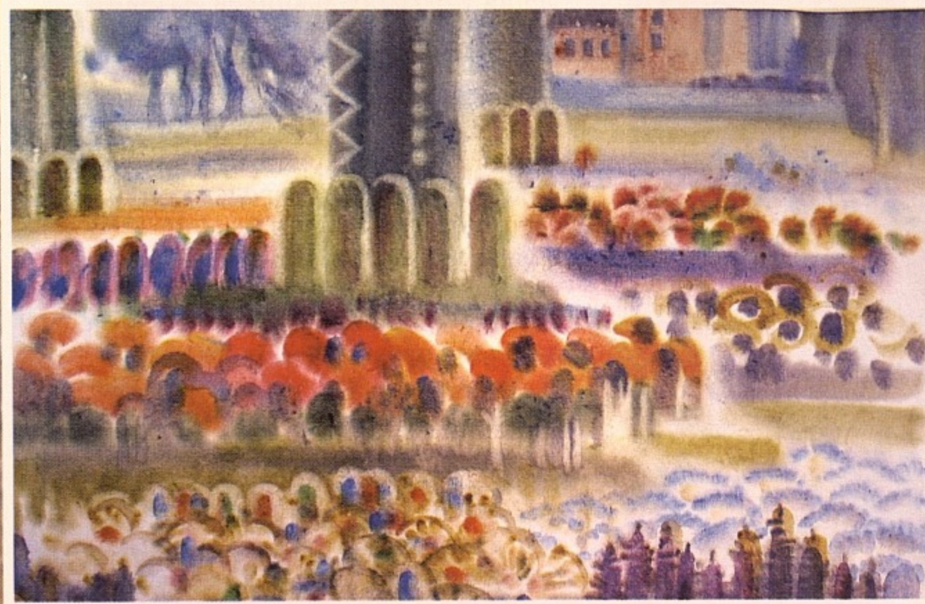
«Городская площадь. Рига», бумага, акварель, 2007. «Цветочный ковер», бумага, акварель, 2007. «Цветы», бумага, акварель, 2007. «Яхты», бумага, акварель 2007.