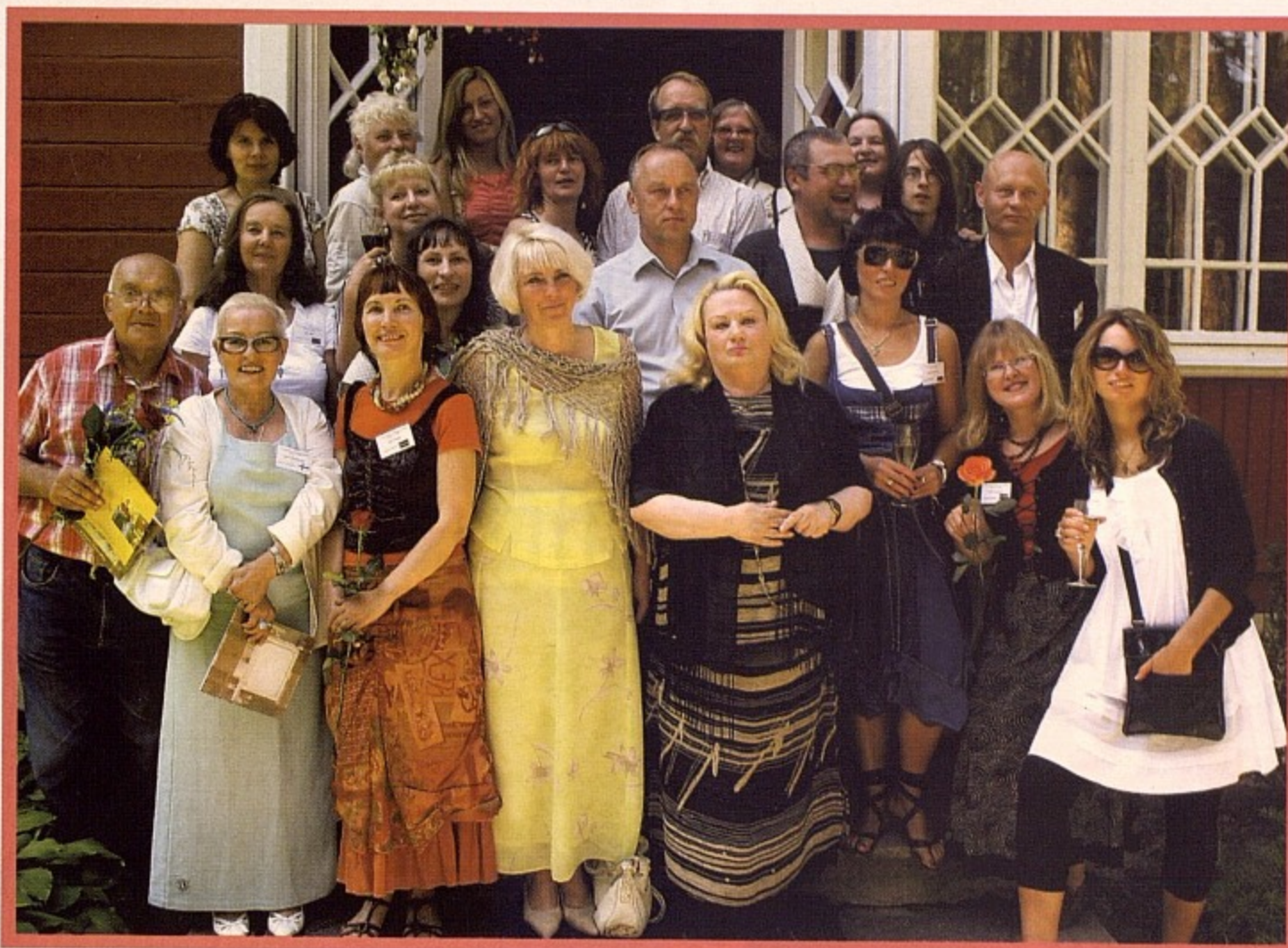
Организаторы и участники фестиваля.

На протяжении веков неизменными остаются аромат прибрежных вековых сосен, шепот волн, крики чаек, звуки музыки в концертном зале Дзинтари, паруса яхт и неповторимые закаты, которые в разное время вдохновляли латвийских художников В. Пурвита, Я. Розенталя, поэтов Райниса и Аспазию, литераторов Д. Писарева, И. Гончарова, М. Горького, К. Федина, К. Паустовского, В. Бианки, В. Брюсова.