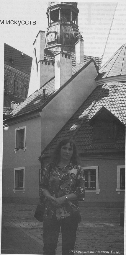
Экскурсия по старой Риге.

Особую атмосферу Юрмалы создает очаровательная деревянная архитектура, богатая резным декором и разноцветными витражами. Большинство «жемчужин» было построено в конце XIX – начале XX в. Город украшают работы немецких, латышских, русских, финских архитекторов: А. Медлингера, В. Бокслафа, Г. Шела, Э. Лаубе и др., в которых гармонично уживаются детали классицизма, югенд-стиля, национального романтизма, историзма, функционализма.