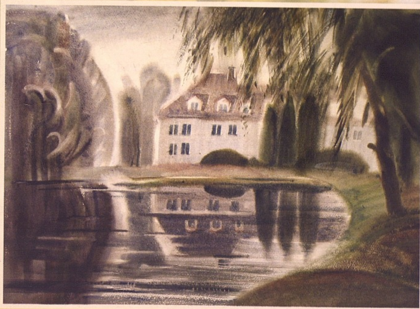
«Школа садоводства», бумага, акварель, 2007.

с местными жителями, переводили на латышский язык необходимые выражения, хотя раньше (лет 20 назад) в республиках Прибалтики русский язык изучали во всех шко-