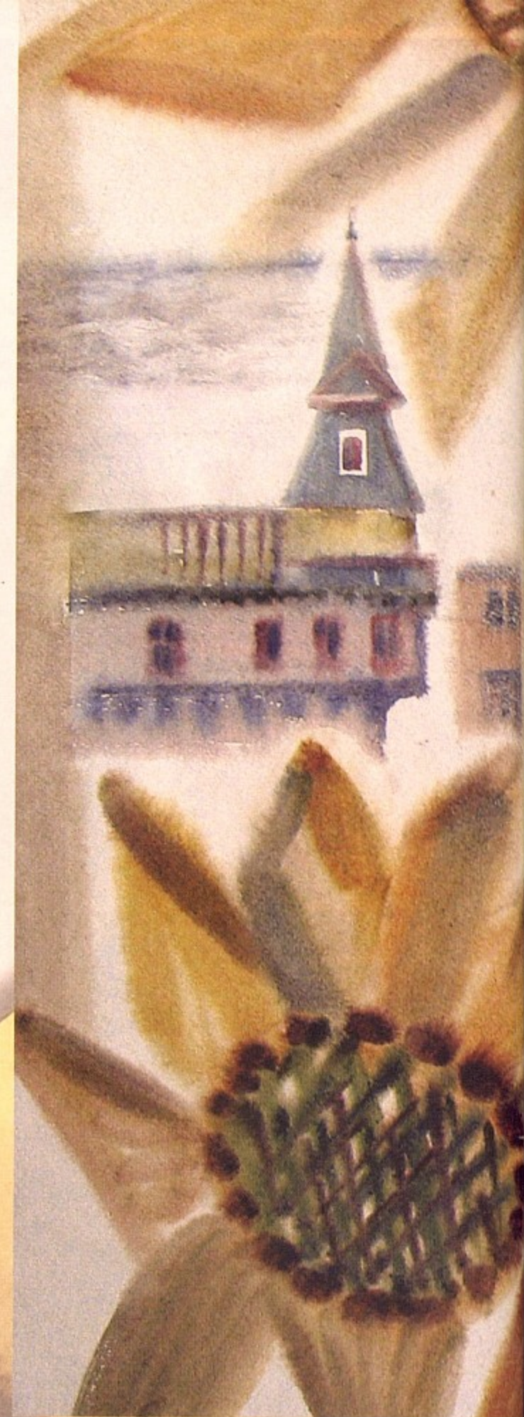
«Юрмала», бумага, акварель, 2007.

Россию, Литву, Латвию, Эстонию, Финляндию, Италию и проживавших одним дружным коллективом.