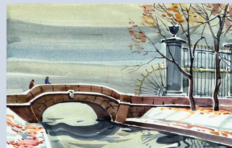
«Исаакиевская площадь», холст, масло, 2006 «Канал в Уккермонде», бумага, акварель, 2004 «Зимняя канавка», бумага, акварель, 1997 «На Мойке», бумага, акварель, 2005 «Рождество в Петербурге», бумага, акварель, 2006