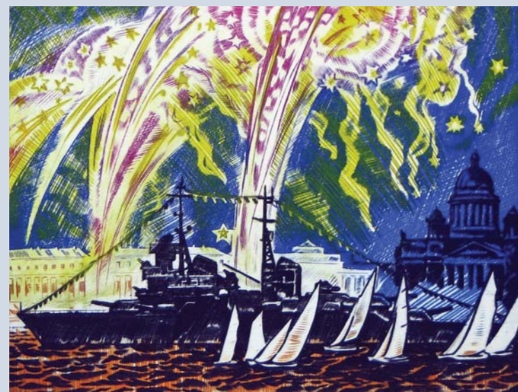
«Натюрморт с вереском», холст, масло, 2006 «Виноградники Прованса», бумага, пастель, 2000 «В долине Аму-Дарьи», бумага, акварель, 1990 «Сентябрь на Лофотенах», бумага, акварель, 1993 «Настурци», холст, масло, 2001 «Праздник флота на Неве», цветной офорт, 1984

повествуется о неоспоримом факте? В каких красках показывать «дела давно минувших дней, преданья старины глубокой»? Эти и подобные им вопросы не раз вставали перед Юрием Васильевым с той существенной оговоркой, что оформить предстояло не мирские опусы, а эпизоды из истории Православия.