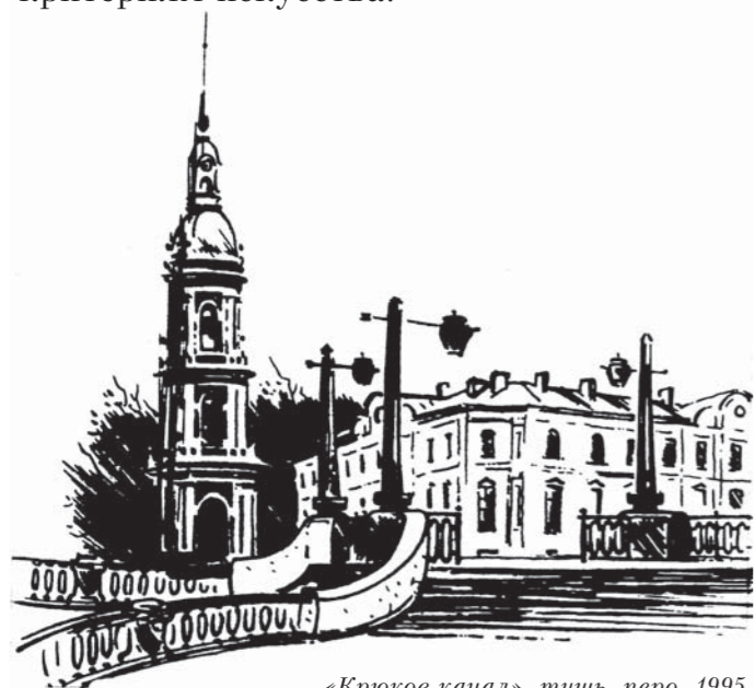
«Крюков канал», тушь, перо, 1995

Общеизвестно, что иллюстрации к историческим жанрам — занятие весьма сложное и противоречивое. Как, например, изобразить прошлое, не становясь в позу педанта-архивариуса? Допустима ли фантазия там, где