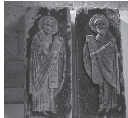
Рельефы в соборе