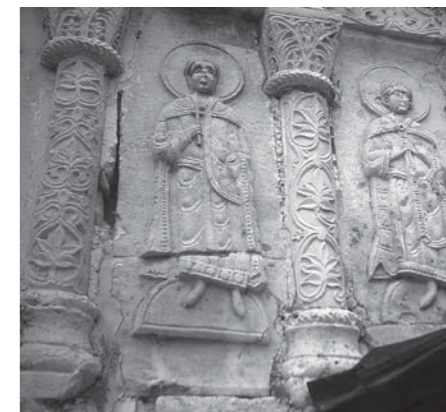
Рельефы на стене храма Святого Георгия