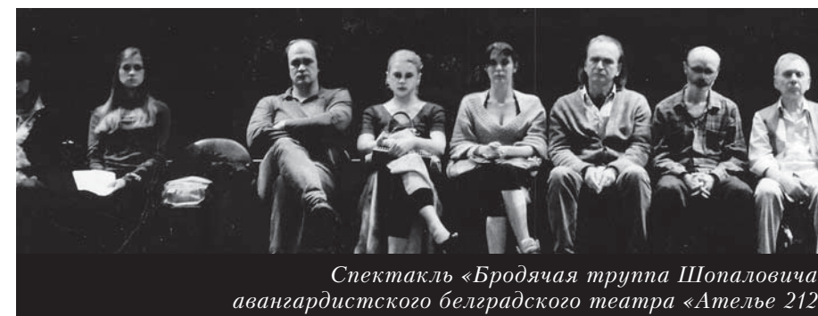
Спектакль «Бродячая труппа Шопаловича» авангардистского белградского театра «Ателье 212»

федры теории и истории культуры. Российский культурологический конгресс объединил отечественных и зарубежных исследователей в области культурологии и смежных научных дисциплин, педагогов и практиков-организаторов культурной деятельности, а также экспертов в области социокультурных проектов и программ. Тема конгресса прямо соотносена со стратегиями ЮНЕСКО в области культурного разнообразия и культурной политики в условиях глобализации. Усилия участников конгресса были направлены на сохранение материального и нематериального наследия как классической культуры, так и народных традиций, и придание им нового импульса в контексте формирующейся на наших глазах глобальной цивилизации, на развитие творческого потенциала как нации в целом, так и отдельных художественных коллективов и сообществ, совершенствование национально-культурной политики в направлении межкультурного диалога, воспитание толерантности в условиях интенсификации миграционных процессов, поддержки творчества и инноваций.