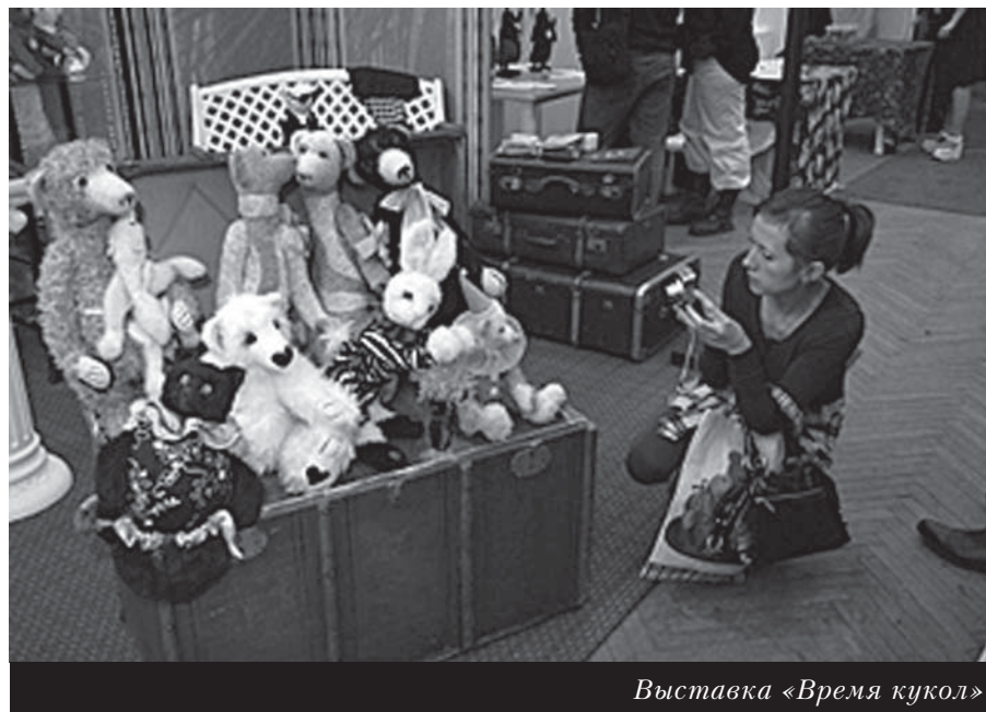
Выставка «Время кукол»

В дни белых ночей Санкт-Петербурга собрались и лучшие художники со всего мира на выставке «Время кукол №3». Новые коллекции авторских кукол и мишек «Тедди», так необходимых нашим детям не только из разных регионов и городов России, но и из Италии, Германии, США, Швейцарии, Бельгии, Нидерландов, Канады, Франции, Японии, Финляндии, можно увидеть в выставочном центре Санкт-Петербурга в Союзе художников. В июне и декабре прошлого года в Санкт-Петербурге уже можно было посетить подобную выставку «Время кукол №1 и №2». Эти выставки организованы совместно с Общероссийской общественной организацией — центром по оказанию помощи детям-инвалидам с нарушением опорно-двигательной системы в целях обеспечения равного доступа к культурным ценностям для всех социальных групп. На выставках, наравне с профессиональными художниками, выставляются «медведи», выполненные совсем юными авторами, занимающимися созданием всеми любимой игрушки — плюшевым мишкой. «Все лучшее — детям», — так полагает Валерий Гергиев. Я был бы одним из самых счастливых руководителей, которые работают на культурном пространстве России, если бы мог адресовать нашу творческую работу прежде всего школам и вузам Петербурга. В период кризиса стоит подумать о том, что еще больше внимания