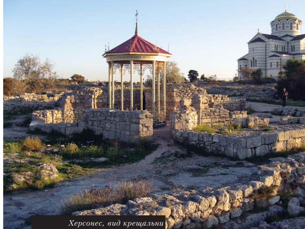
Херсонес, вид крещальни

Но не только этим известен Св. Иоанн Готский. Он был выдающимся борцом с иконоборцами и в то трудное время принимал бежавших от преследований и убийств, приходивших по всей империи, людей, сохранивших верность почитанию икон, верность православию, хотя это и было сопряжено с немалым риском для жизни. После кончины мощи Св. Иоанна были перевезены в Крым, на его родину, место, что ныне называется Партенит, у подножия горы Аю-Даг. В Партените сохранились остатки храма, построенного при Св. Иоанне Готском и раскопанного в конце XIX века на территории имени Раевских (еще одно славное имя). На городище Эски-Кермен также сохранился храм, связанный с именем святого, в алтарной части которого в камне вырублено сиденье горнего места для епископа. Свод храма пострадал и обвалился от землетрясения 1935 года, да киношники