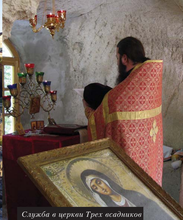
Служба в церкви Трех всадников