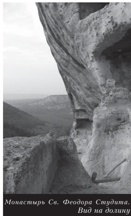
Монастырь Св. Феодора Студита. Вид на долину

Мы долго искали этот храм, потому как никто из местных жителей не имел о нем понятия, да, видно, и не интересовался никогда этим вопросом. Хотя и стоит он на достаточно видном месте, и сохранился лучше других древних церквей Херсонеса, но длительное забвение своей истории, намеренно внедряемое пропагандой атеизма, сделало свое губительное дело, люди забыли о великих делах минувшего. А ведь это только малая часть из многих историй, что вспоминаются, когда бродишь по развалинам Херсонеса, и рассказывать об этом можно много и долго; но нам нужно было ехать дальше, в горы Крыма, где находится множество скальных храмов, монастырей, городов. Перед поездкой мы готовились увидеть эти места, читали, просматривали карты. Но то, что открылось нам, поразило большим сходством с Каппадокией, областью нынешней Турции, где когда-то, во времена Византии, расцвела оставившая великое наследство духовная мысль христианства, давшая множество великих святых, из имен которых достаточно назвать такие, как Св. Георгий, Св. Нина, Св. Василий Великий, Св. Григорий Богослов и Григорий Нисский, Св. Иоанн Русский и Арсений Каппадокийский... В этом замечательном ряду стоит и святой крымской земли епископ Иоанн Готский. В поисках мест, связанных с его именем, мы приехали к подно-