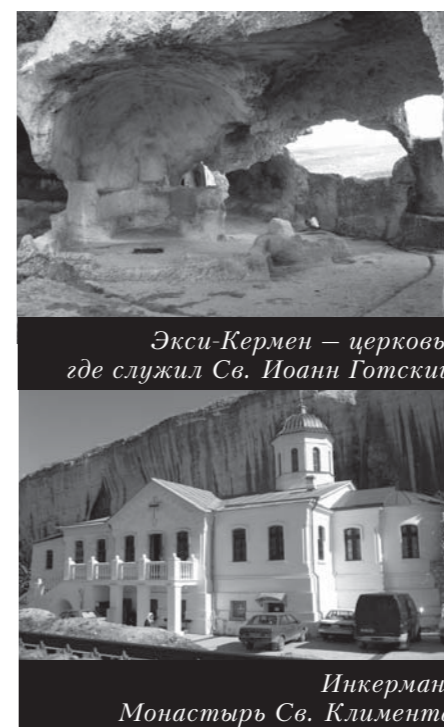
Инкерман. Монастырь Св. Климента