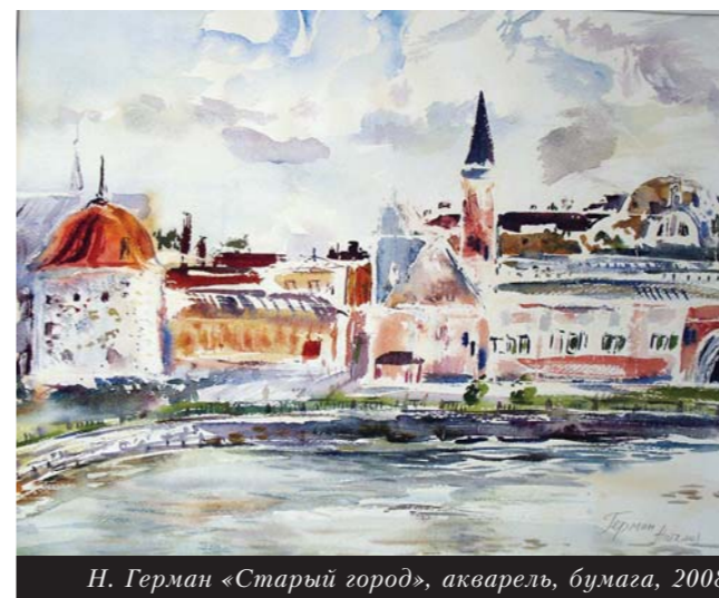
Н. Герман «Старый город», акварель, бумага, 2008