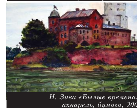
Н. Зива «Былые времена», акварель, бумага, 2008