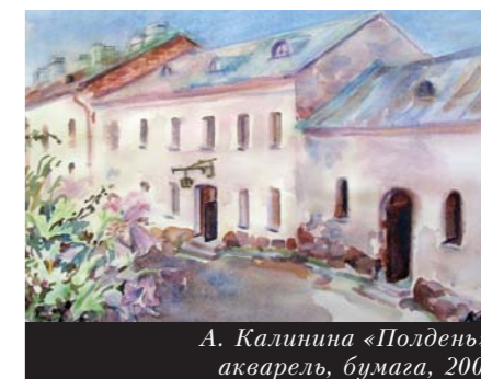
А. Калинина «Полдень», акварель, бумага, 2008