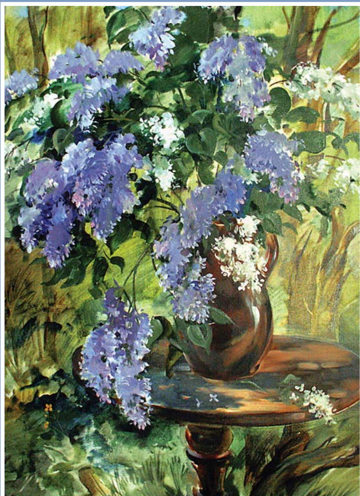
«Лето. Сирень», холст, масло, 2007