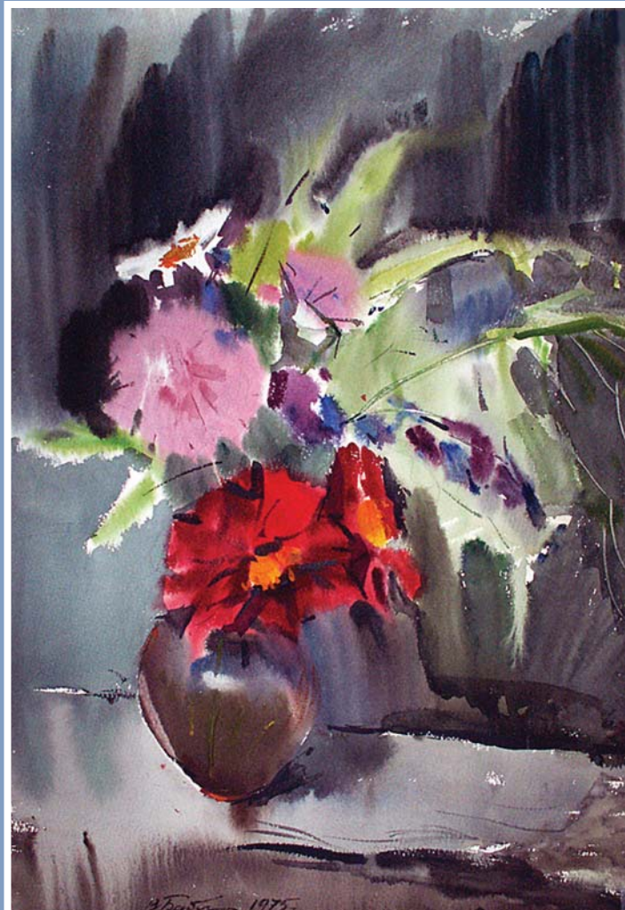
«Букет», бумага, акварель, 1975