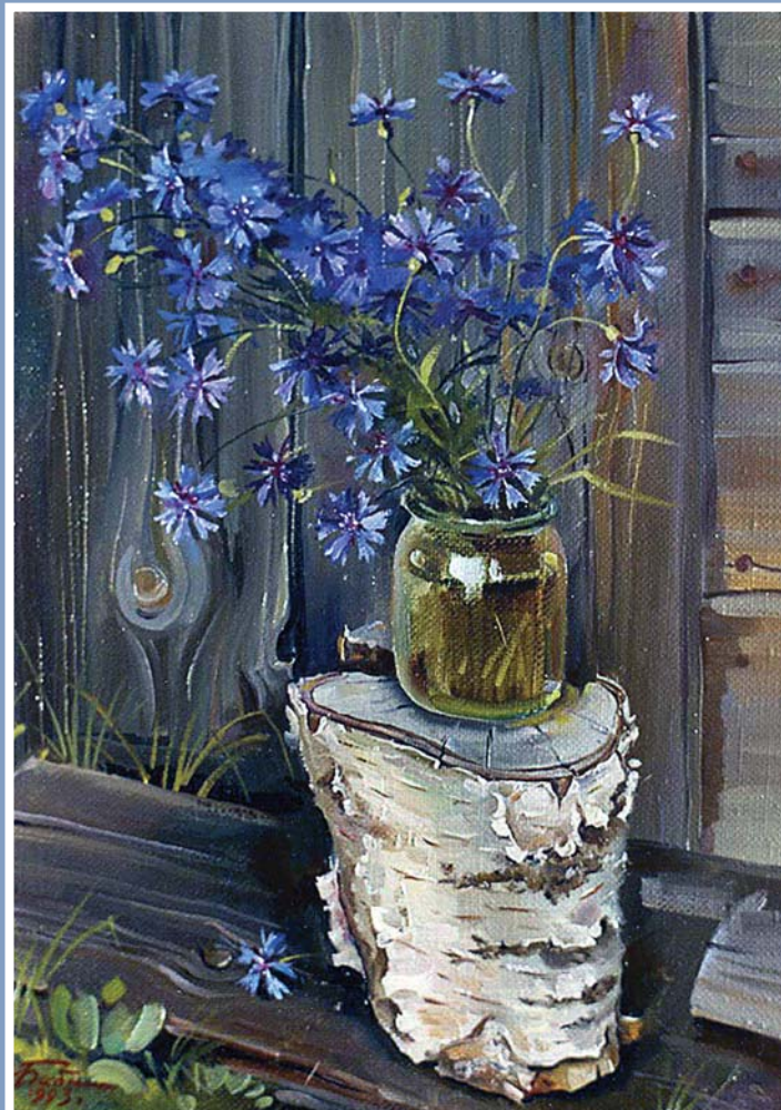
«Васильки», холст, масло, 1993