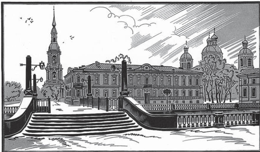
Никольский собор. Санкт-Петербург. Цветная гравюра на пластике. 1987.

Вот и кончилось оно — многих лет стремленье: Диссертацию писать — сладость и мученье! Сладость — тайны постигать, покорять орбиты. А мученье — ожидать празднества защиты.