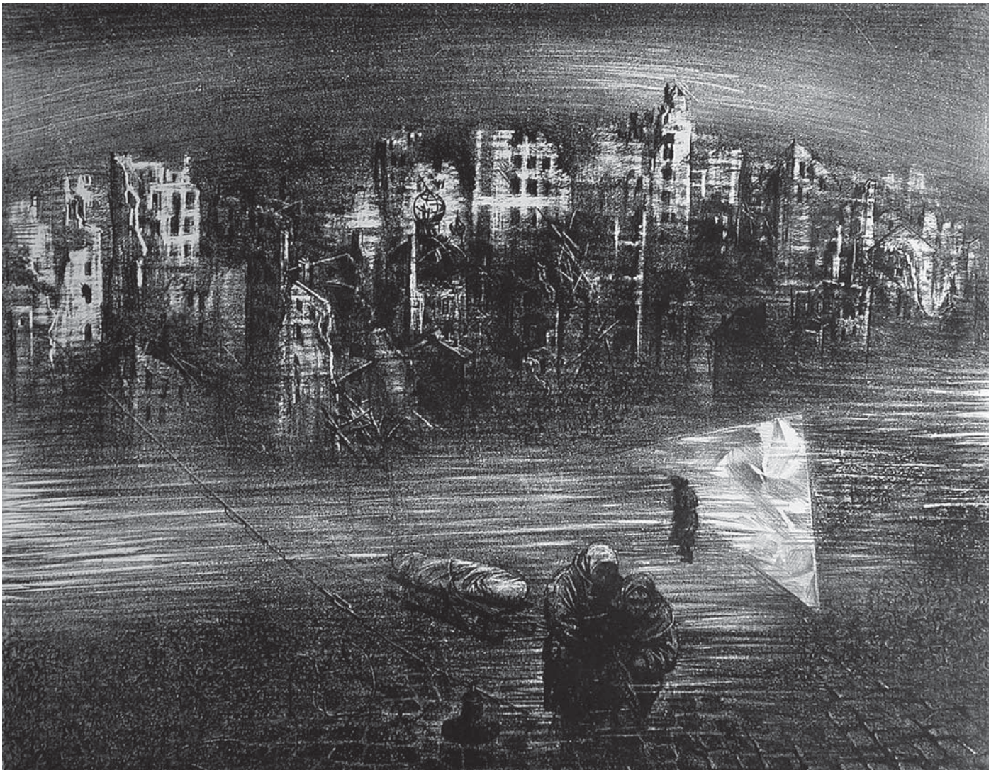
А. Корольчук «Город», из серии «Письма войны» литография, 1987.

как я люблю Ленинград. Ведь всю жизнь я в нем жила, когда уезжала, то всегда скучала о нем и стремилась назад. Много хорошего и плохого пережито, да, в ужасную эпоху я попала жить. Японская война, революции 1905 г. и 1917 г. германская имперская война, финская война, и вот теперь весь этот кошмар, захват фашистами Норвегии, Дании, часть Франции, Греции и др. стран; а теперь и нашу территорию временно оккупировали. Что-то будет, когда они выдохнутся! Техника, дисциплина, немецкая аккуратность и точность, ну мы-то в другом роде народ. На юге наши дела неважны. Геройски защищается Сталинград (бывшее Царицыно), но они идут к Грозному. Начинает хотеться есть. У меня нет хлеба, есть селедка, изюм, шоколад. Съела селедку без хлеба, выпила чаю с шоколадом, да еще вина «Кагор». Плитку я протопила, согрела кофе и чай. «Лукулловский пир» устроила в одиночестве при свете коптилки. Напилась воды..., под глазами, да и ночью беспокойно спать буду, если бы было побольше хлебца, а крупы у меня немного есть; да дома, ну —