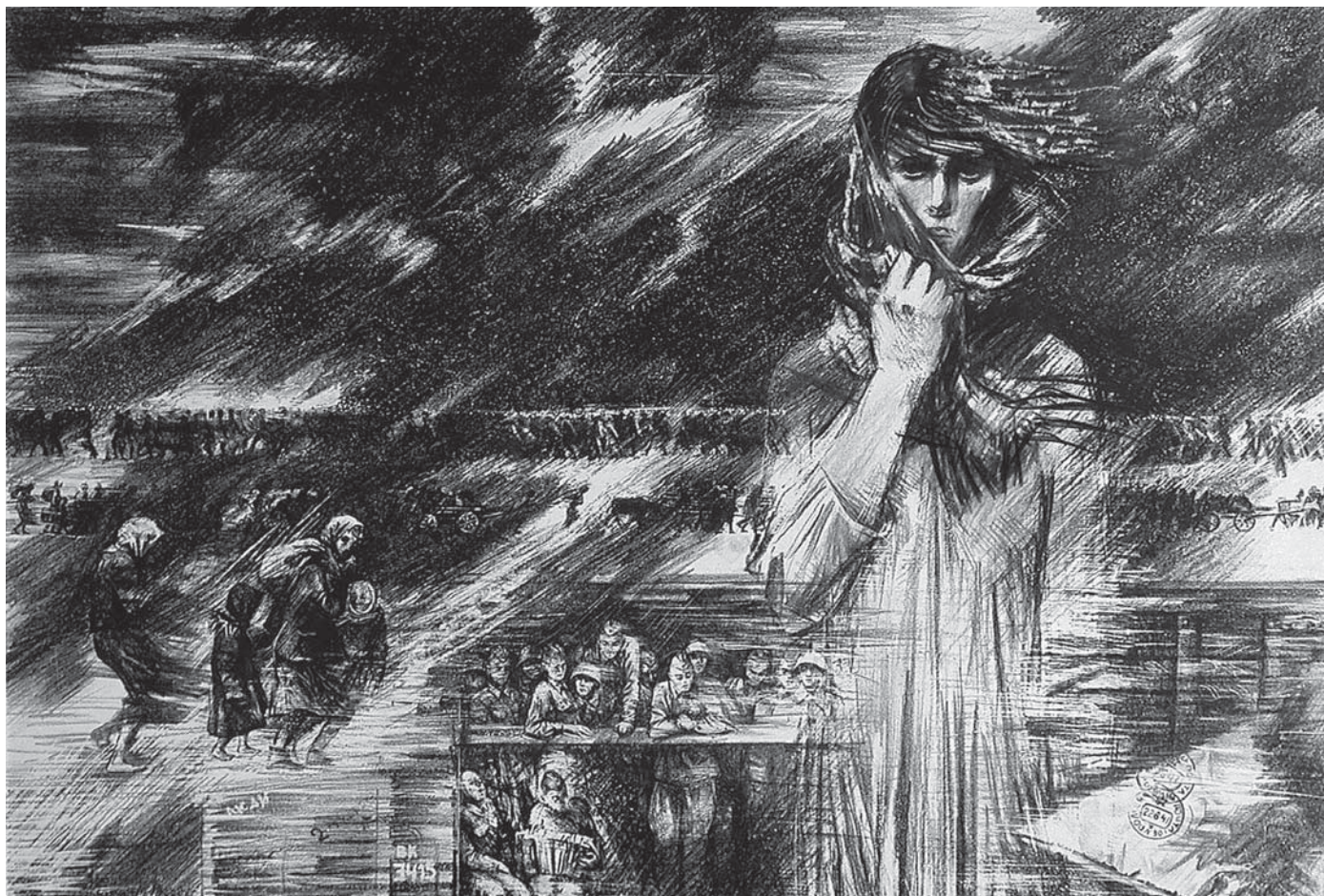
А. Корольчук «1941 год» из серии «Письма войны», литография, 1987.

смотря на это здание, в котором я с большим удовольствием работала.