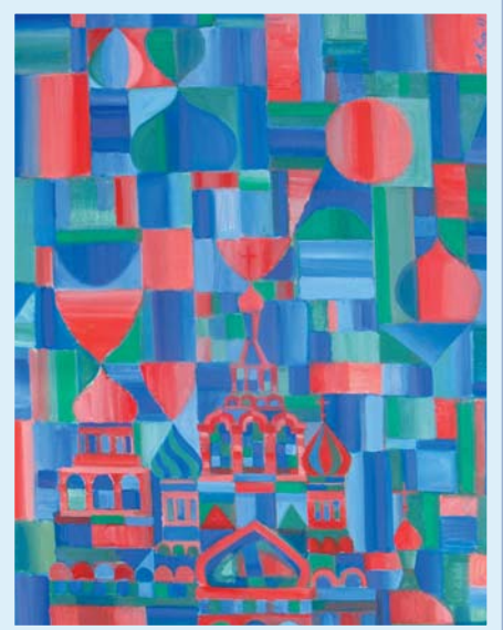
«Благодать», холст, масло, 2009 «Храм», холст, масло, 2009 «Весенний сюжет», бумага, акварель, 2007 «Южный город», бумага, акварель, 2010 «8 марта», холст, масло, 2010