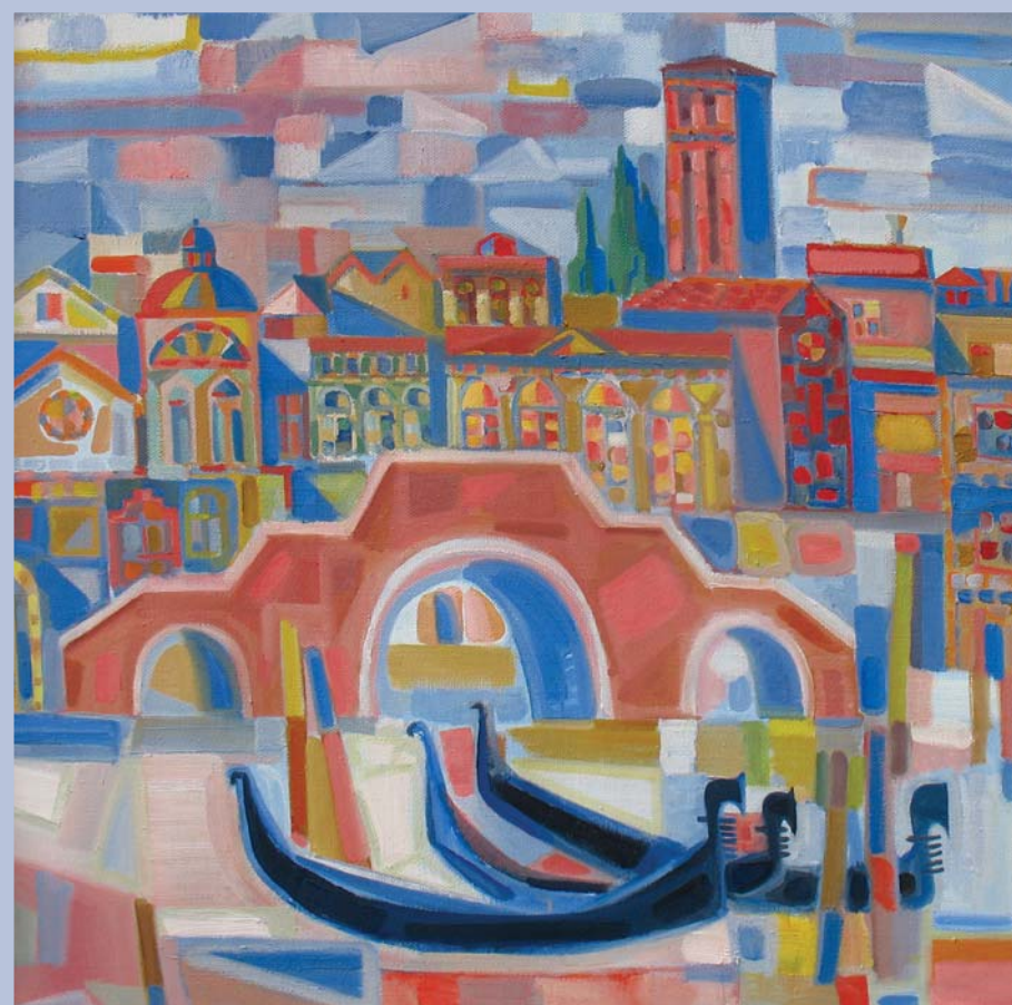
«Стрелецкая слобода. Великий Устюг», бумага, акварель, 2010; «Венеция», холст, масло, 2008

нам дается возможность приблизиться к высшей истине, увидеть свет, достигнуть просветления духовного.