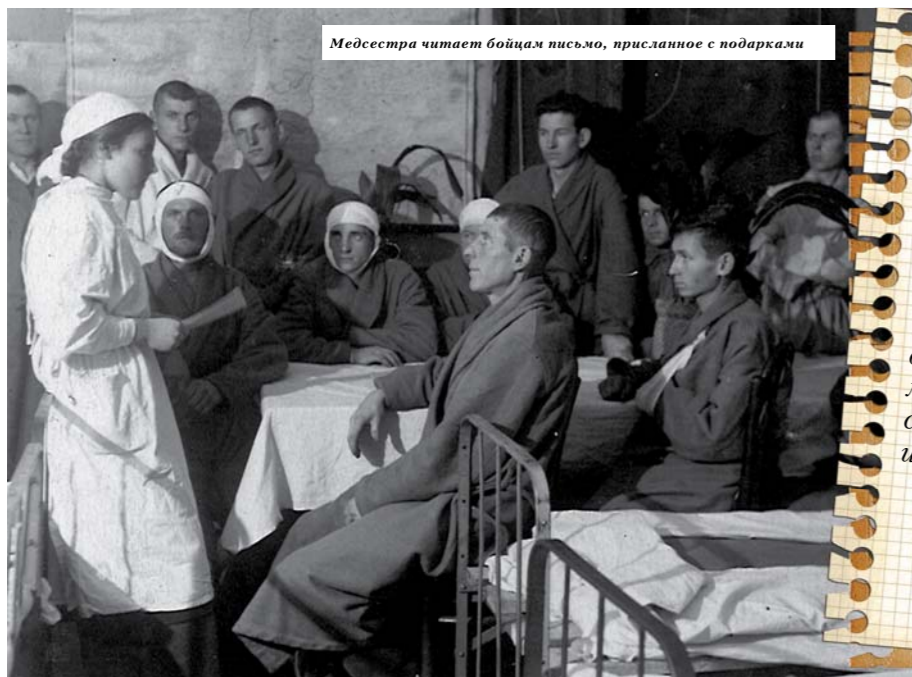
Медсестра читает бойцам письмо, присланное с подарками