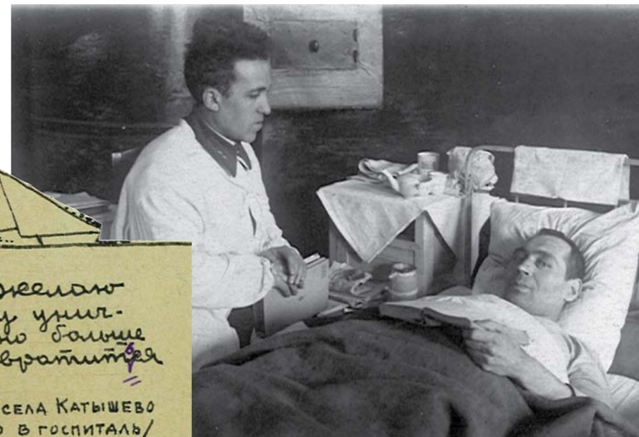
Обсуждение прочитанной книги

Человек мирной профессии, он был удостоен боевого ордена Красной Звезды и одним из первых возобновил работу в университете в 1943 году. Зимой 1941-1942 от голода погибли шесть профессоров и пять доцентов, не досчитались многих студентов. Институт понес невосполнимые потери. В этих условиях дирекция прилагала все возможные усилия для эвакуации вуза из блокадного Ленинграда. Первым её успехом стал вывоз в декабре 1941 года так