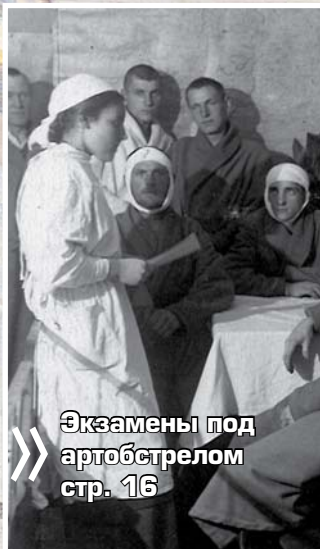
Экзамены под артобстрелом стр. 16