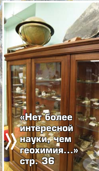
«Нет более интересной науки, чем геохимия...» стр. 36