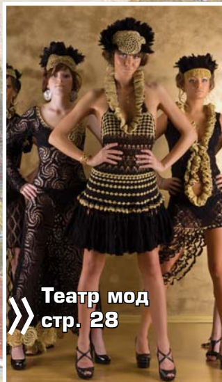
Театр мод стр. 28