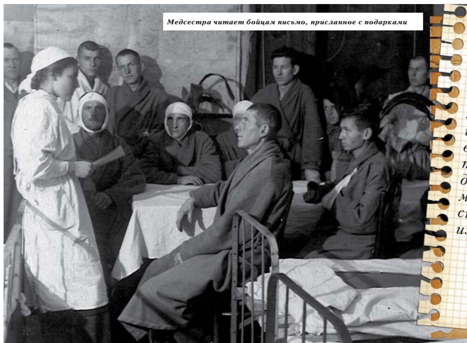
Медсестра читает бойцам письмо, присланное с подарками