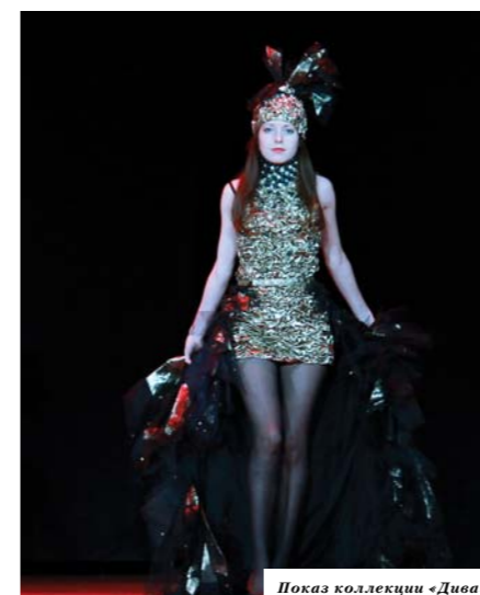
Показ коллекции «Дива»