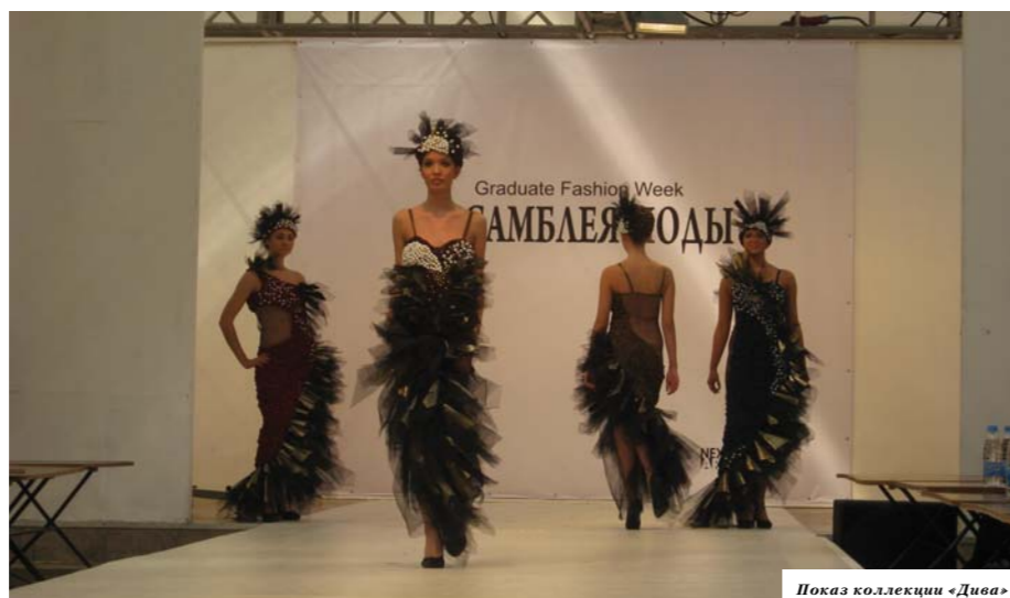
Показ коллекции «Дива»